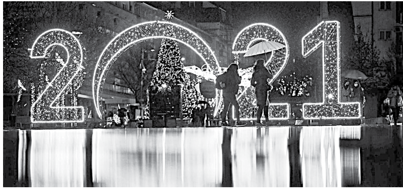
'People all over the world are pinning their hopes on the vaccines and planning to start a new life in 2021.'

In addition to the loss of lives, what affected us most are the disruptions to normal life and their impact on economy. Either due to lockdown or safety reasons, people were confined to their homes. Educational institutions were closed. Markets shrank. Many offices and small businesses were closed. In the process, a significant portion of the workforce lost their jobs. People in the low-income group suffered the most. They depended heavily on charities by the government and non-