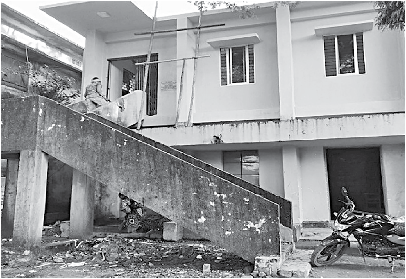
The Tahirpur upazila library building that houses everything but a library.