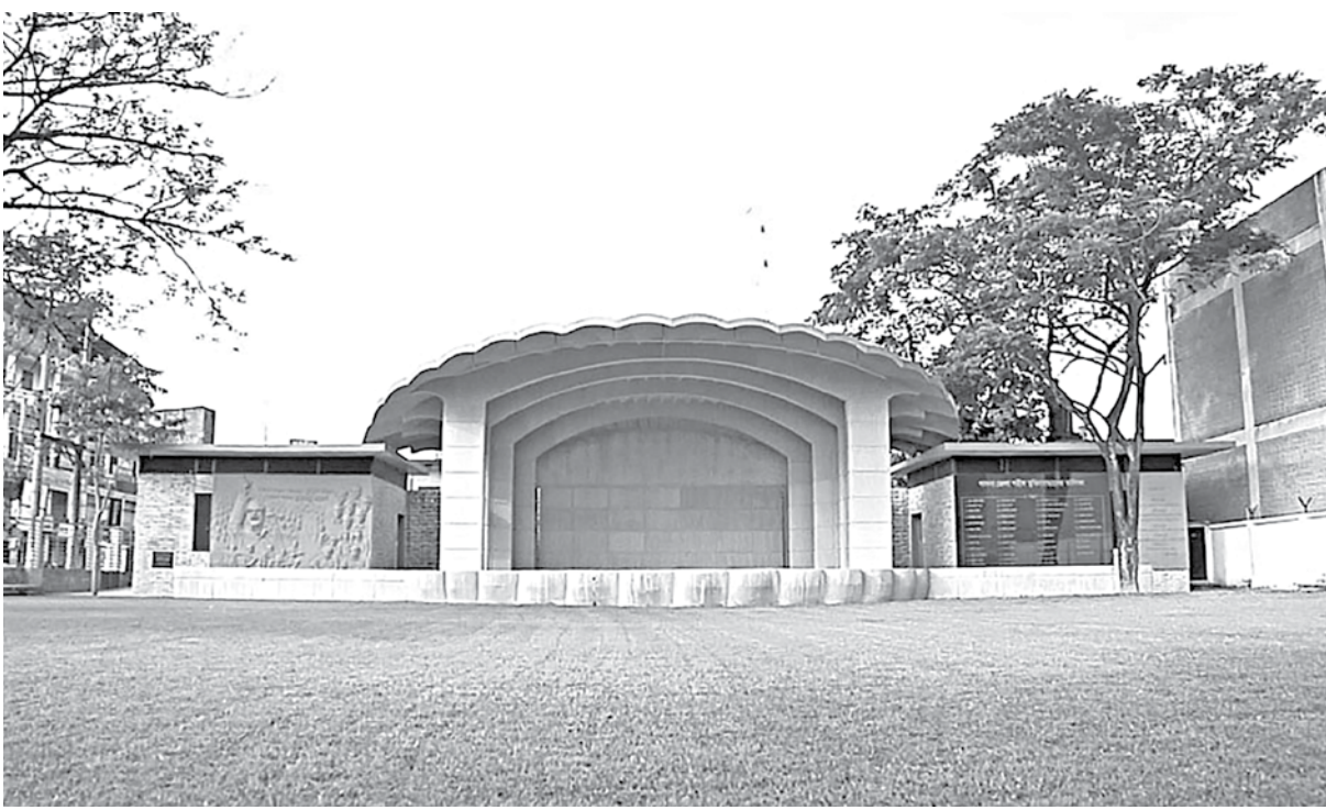
Prime Minister Sheikh Hasina will inaugurate this newly built Independent Square on the historic Pabna Town Hall premises through a video conference from Gono Bhavan today.

LGRD Minister Md Tajul Islam said, "We have received allegations of misappropriating government aids by several local representatives. We have already sacked some of them and investigations against some of them are in progress. If allegations are proved, we shall take necessary action against them as well."