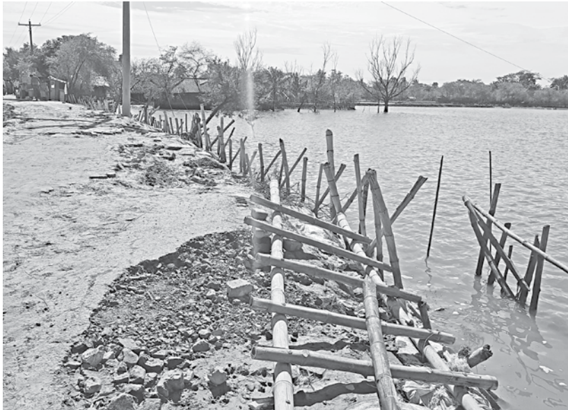
A damaged embankment in Sathkira's Ashashuni upazila.

As the worst affected area, Pratapnagar union received a sizeable portion of this relief, but many villagers alleged that most of them