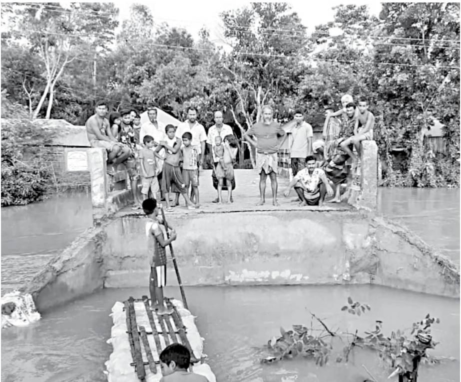
A bridge has been damaged by flood at Char Pakulla in Tangail Sadar upazila.

“We have already estimated the damages and also sent the reports to the higher authorities. We hope we will get necessary funds and start the renovation works as soon as possible,” he added.