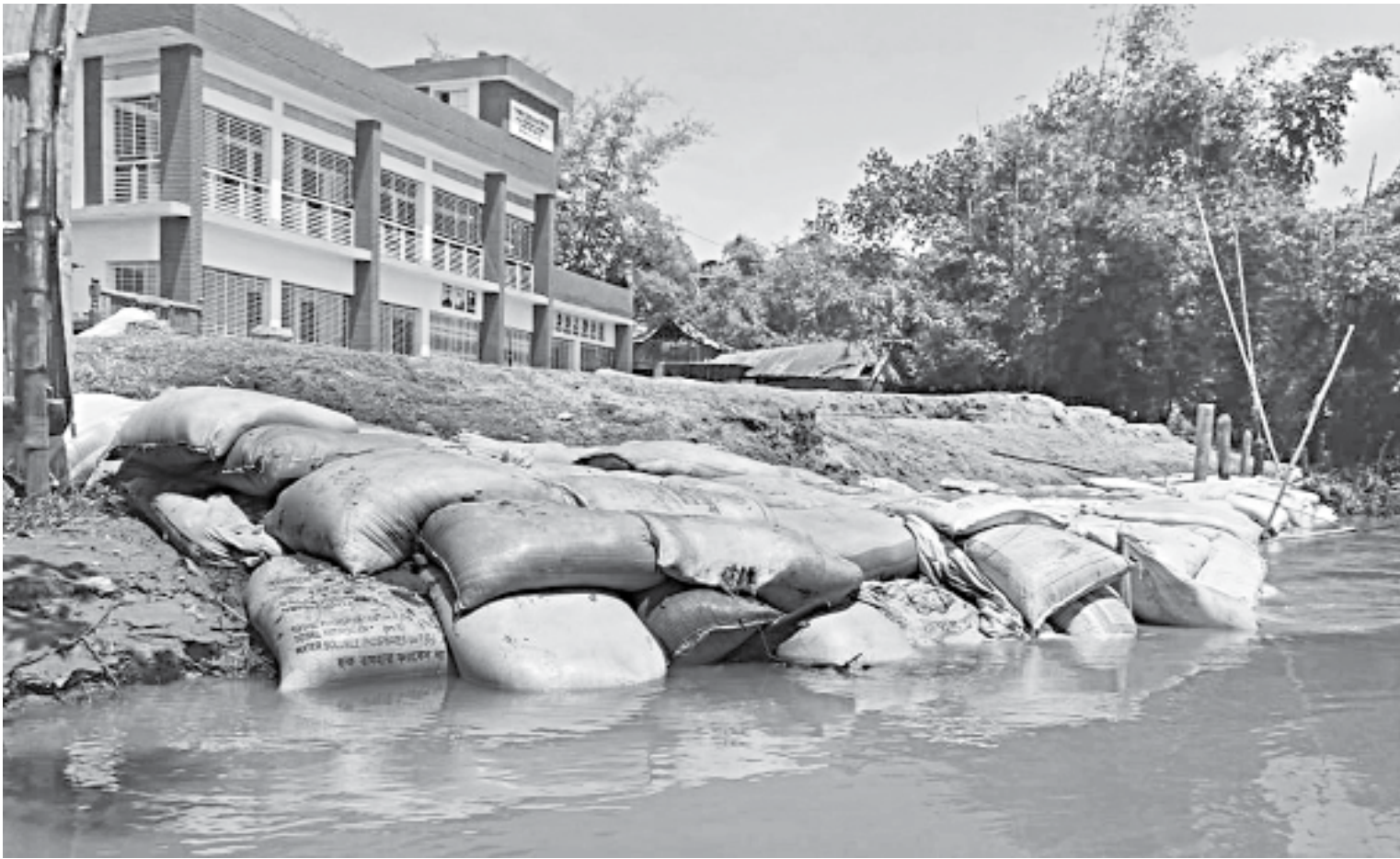
Shankardaha Government Primary School in Rangpur's Gangachara upazila remains under threat due to erosion by the Teesta that changed its course a few days ago. Below, approach to this road at Ichli village in the upazila was washed away by the strong current of the river recently