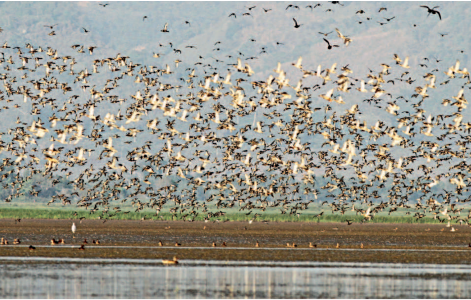
A huge flock of migratory birds fly over one of the many waterbodies in Sunamganj’s Tanguar Haor. Birds of several rarely-seen species visit the area around this time of the year.

The following morning, Rokeya went to the room around 7am and saw its furniture and belongings scattered, while a window grille was broken. The family suspects miscreants may have entered by cutting the grille.