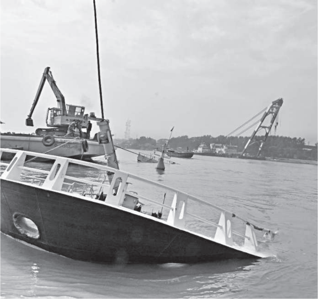
Attempt to salvage this cargo vessel is underway after it capsized in the Kirtankhola river on December 14. The photo was taken yesterday morning.