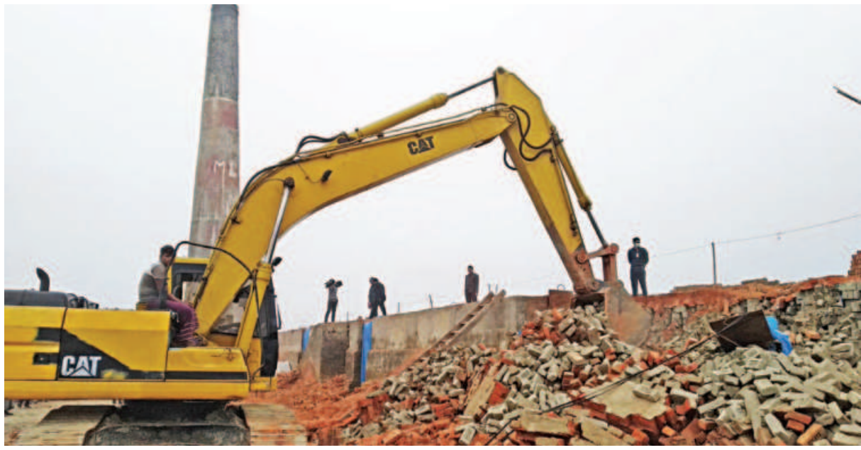
An illegal brick kiln being dismantled by the Department of Environment in Savar yesterday.

4 companies fined Tk 33 lakh; owner, manager jailed