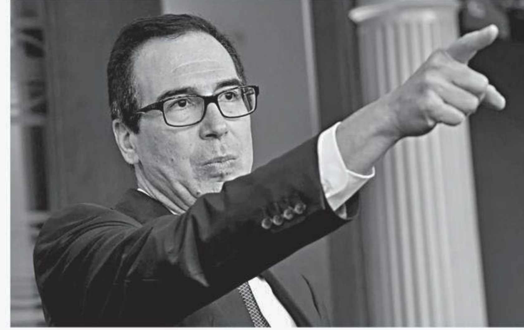
US Treasury Secretary Steve Mnuchin

Mnuchin said the deal with China aimed to create more reciprocal trade relations for many years, adding that