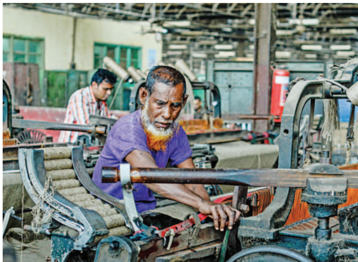
An elderly worker operating a machine at Platinum Jute Mill in Khulna yesterday. Workers of nine state-run jute mills postponed their hunger strike for three days, following government assurance of meeting their demands.