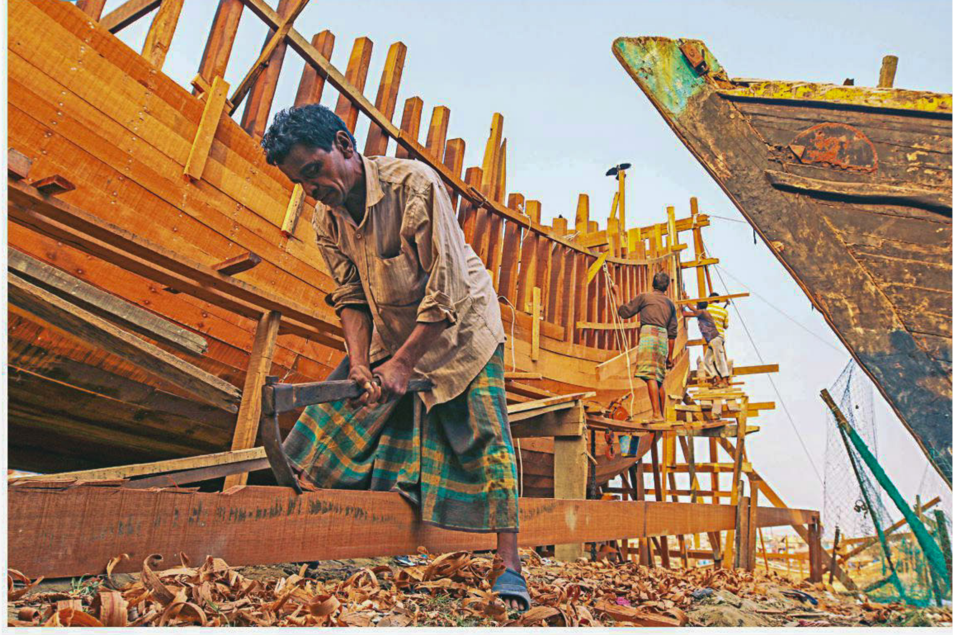
With rows of nearly finished and some unfinished wooden boats lined up by the banks of Karnaphuli and craftsmen busy working, Fisheryghat area in port city is abuzz with activities these days. Each of these watercrafts requires rigorous craftsmanship for around three months. The vessels then set sail on the Bay of Bengal for fishing. According to boat makers, the dry season is the ideal time for making fishing boats, which come with a price tag as high as Tk 1 crore.