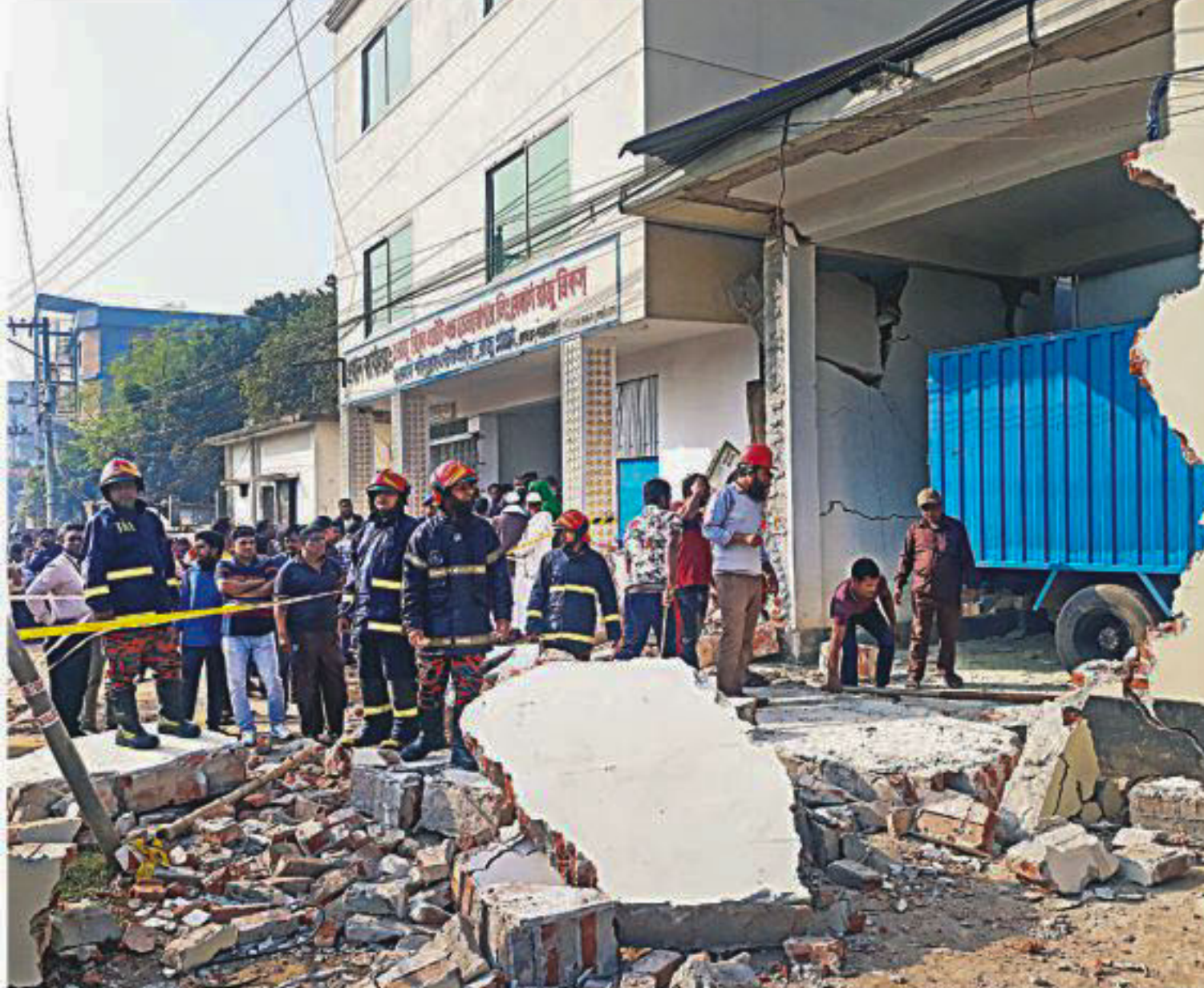
An explosion destroyed the walls of a sweater factory in Ashulia, killing a woman and injuring five people.