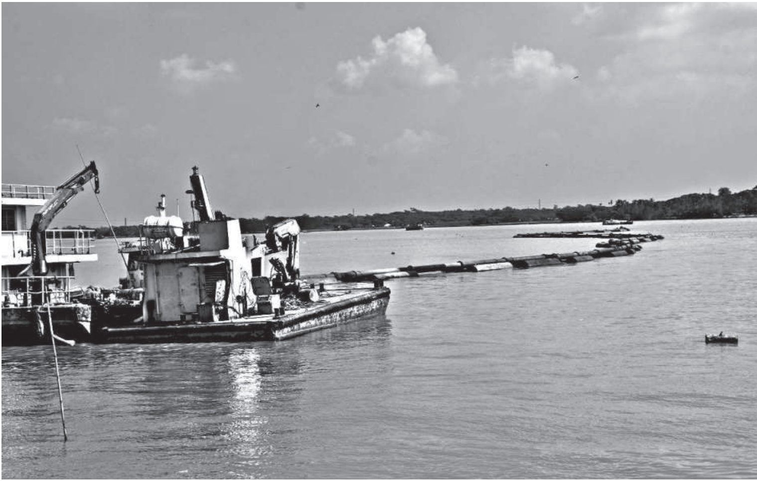
Like this one in the photo, 10 dredgers have been engaged at as many points of six rivers -- Meghna, Kalabodor, Tentulia, Khakdon, Karkhana and Kirtonkhola -- under Barishal region.