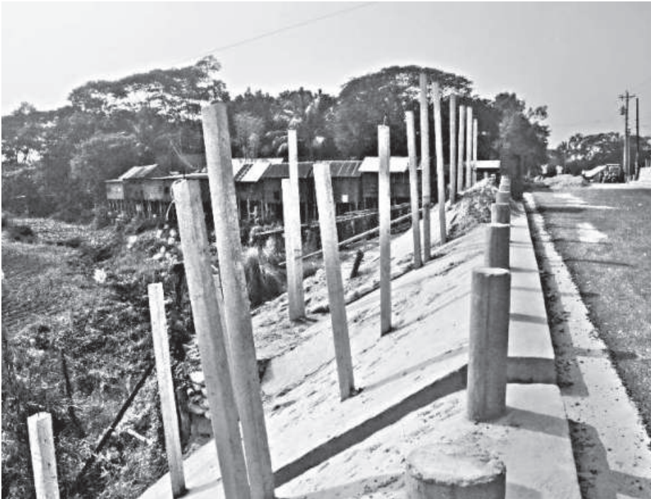
Concrete pillars and shops are made on the land of a canal and the approach road of the newly constructed bridge over the waterbody at Chhatiantoli of Sirajdikhan upazila in Munshiganj, bearing testimony to the land grabbers’ ongoing attempt to occupy the site.