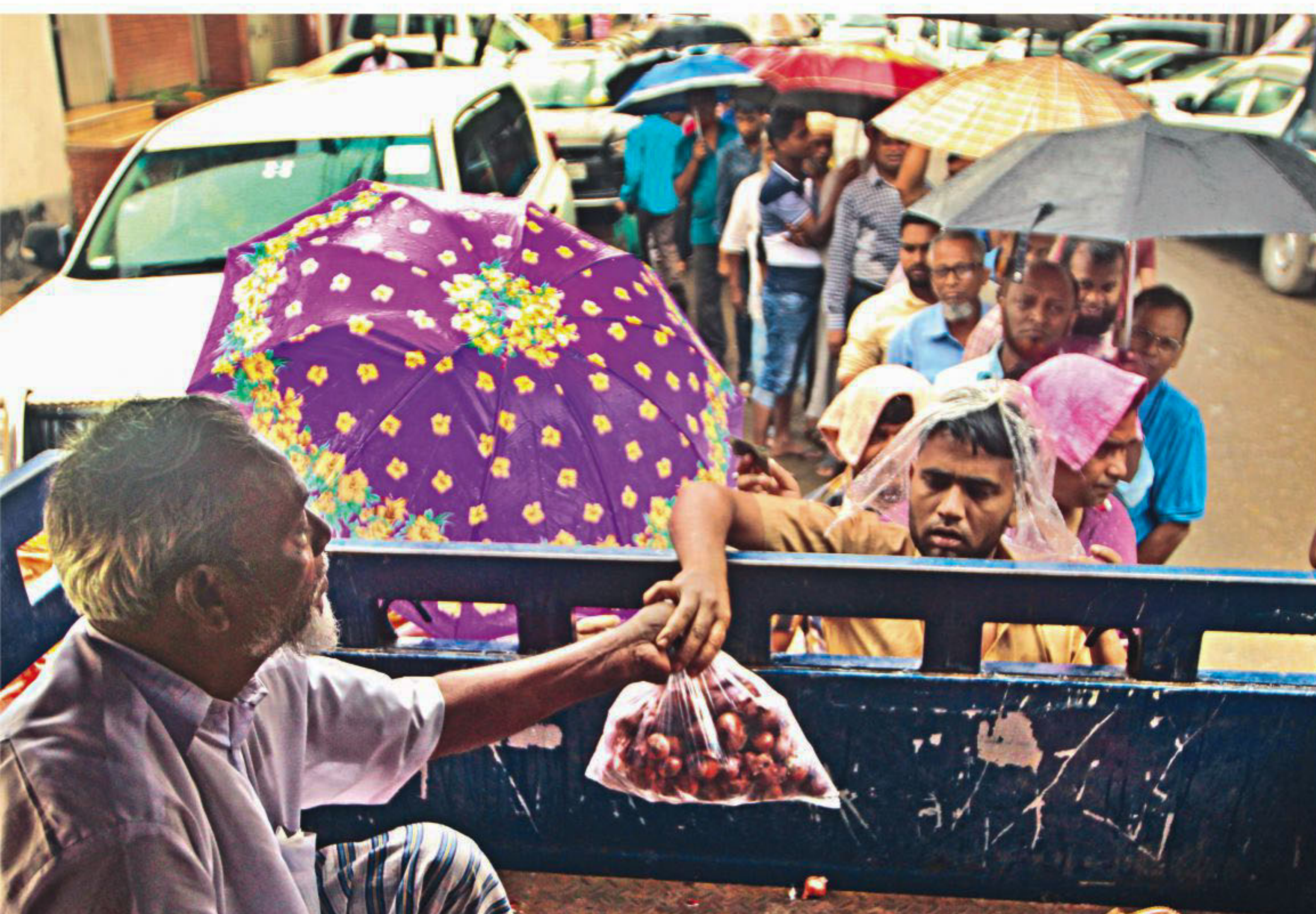
Braving incessant rain, people queue up with their umbrellas to buy onions from a TCB truck at Tk 45 per kg. The photo was taken yesterday from Secretariat Link Road.