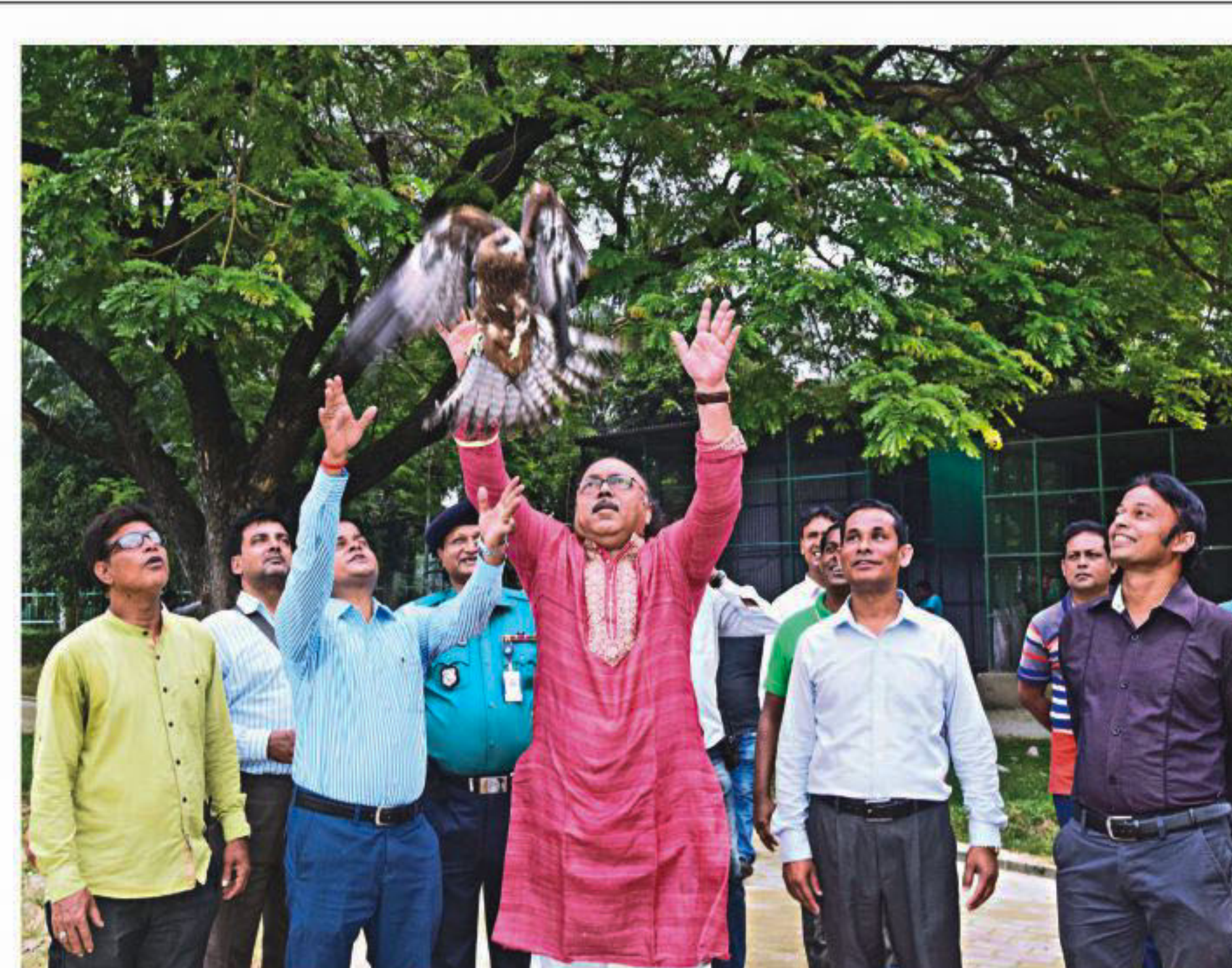
Rajshahi Mayor AHM Khairuzzaman Liton releases a bird from the city's zoo on Wednesday.

STAFF CORRESPONDENT, Rajshahi Rajshahi City Corporation has started releasing birds from its botanical garden and zoo for their proper conservation. Initially, the city Mayor AHM Khairuzzaman Liton released seven black kites (Bhubon Chil), and 20 Black-crowned Night Herons (Nishi Bok) at a function held in the zoo on Wednesday. At least 200 more birds of Shaheed AHM Kamruzzaman Central Park & Zoo will be released in nature within the next week if the weather is good, the mayor said. The mayor said the zoo has around 400 birds of 23 species, some of who are decreasing in number in nature. The zoo had a total of eight black kites - all of who were either rescued after being captured, or donated by individuals over the years, said the zoo's veterinary surgeon Farhad Uddin. He explained that black kites are habituated to fly at a certain height, and they could not breed in captivity at the zoo. "Considering the situation, we decided to release them and help them breed in nature," he said, adding that they kept one black kite as it is ill. He said three species of herons have bred abundantly in the zoo. They would release most of the herons, keeping a few for further breeding, he said.