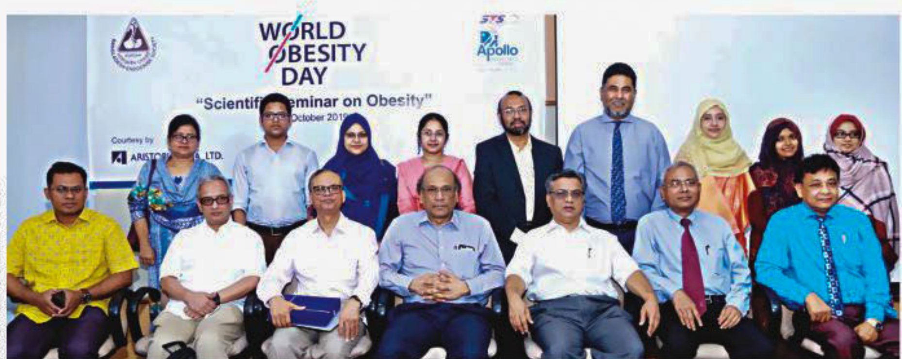
Apollo Hospitals Dhaka organised a seminar, marking World Obesity Day. Senior consultants from Apollo, BSMMU and BIRDEM were present at the event.