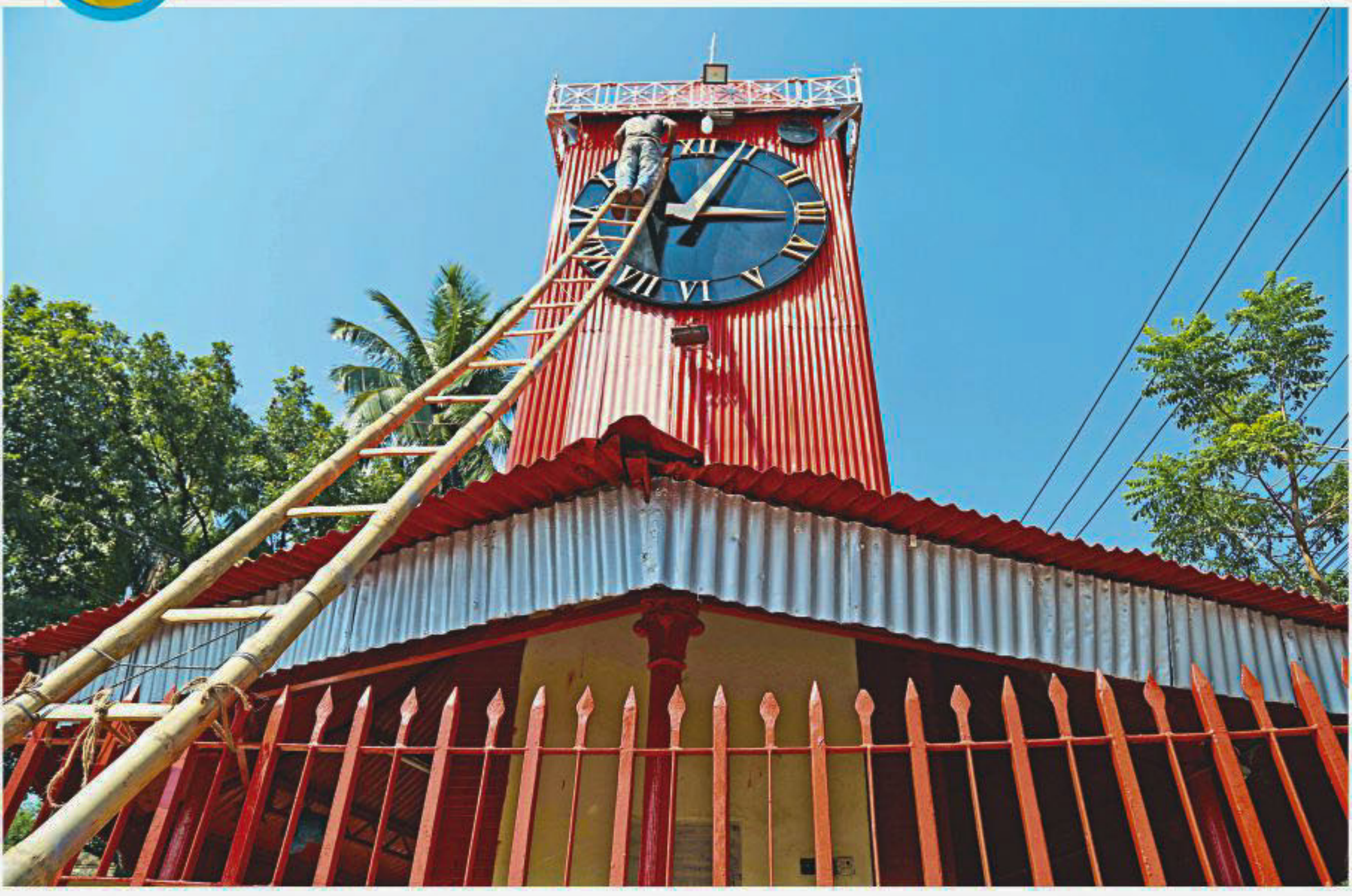
Sylhet city's popular landmark, Ali Amjad's clock tower, is being renovated ahead of a celebration marking the 100th anniversary of Rabindranath Tagore's visit to the city. Prime Minister Sheikh Hasina will join the closing ceremony of the two-day event on November 8 at Sylhet District Stadium. The photo was taken yesterday.