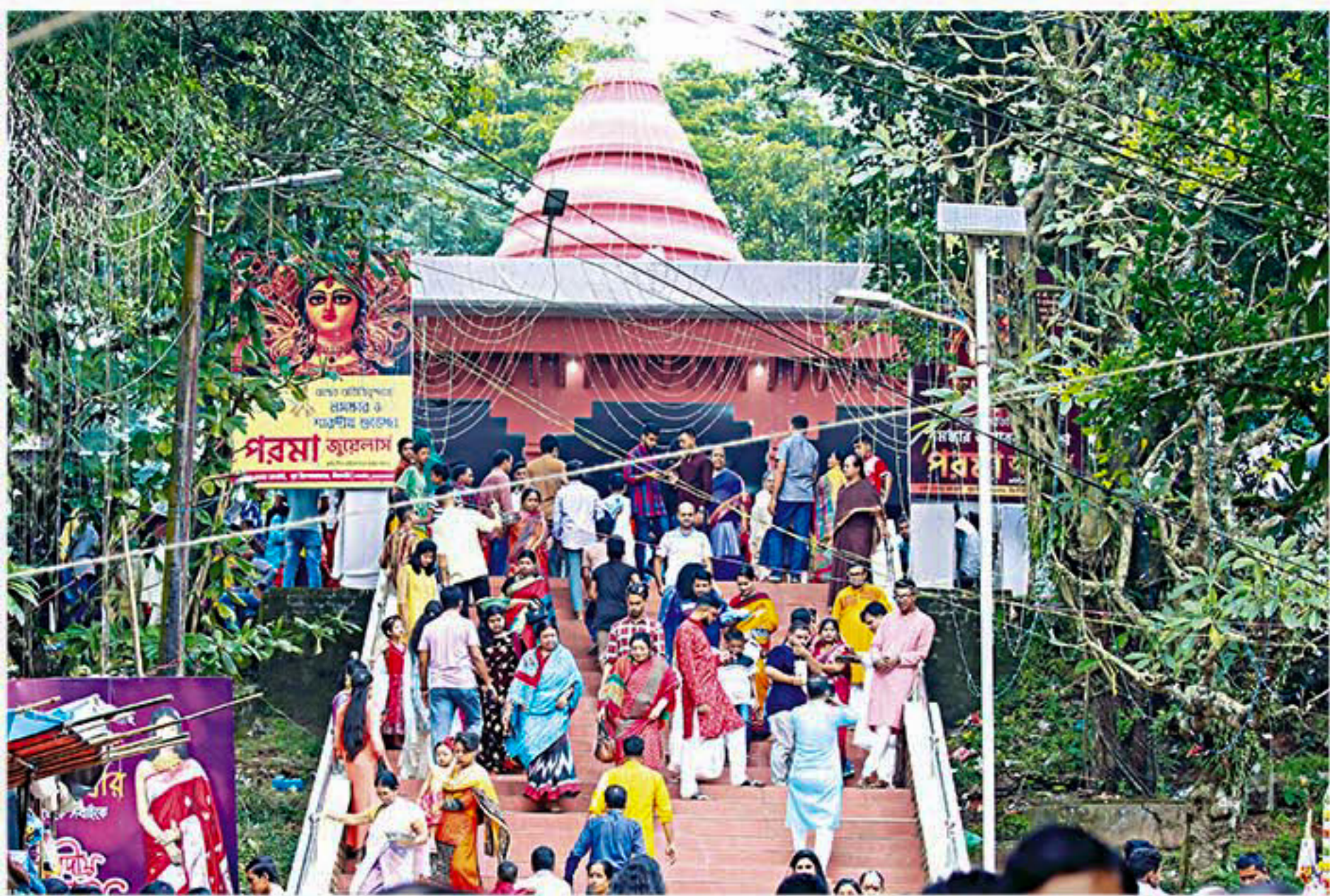
Visitors throng the Durgabari temple in Sylhet yesterday morning, marking Maha Ashtami of the Durga Puja. Situated on top of a hill, the air around one of the oldest temples in the city has been festive over the last few days which will continue till tomorrow, until the immersion of Goddess Durga on Bijoya Dashami.