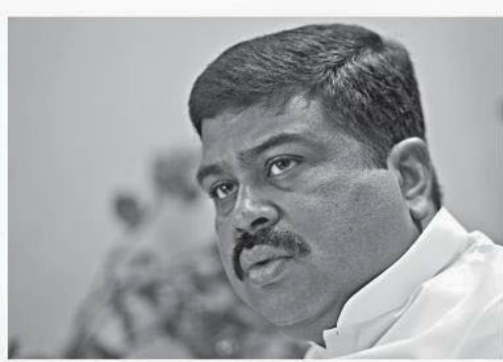
Dharmendra Pradhan honoured. We will look at an appropriate time (to review). In the past also we had renegotiated the deals," Pradhan said. India's biggest gas importer Petronet LNG Ltd

REUTERS, New Delhi India will look at reviewing the pricing of its long-term liquefied natural gas (LNG) deals at an "appropriate time" due to a fall in spot prices, oil minister Dharmendra Pradhan said on Monday. "We will look at reviewing long-term LNG contracts," Pradhan said at a natural gas event in New Delhi. The spot price of imported LNG into Japan, one of world's biggest importers of the super-cooled fuel, has more than halved in the last year. This has led buyers in Japan and China to request delays in term cargoes, while many other countries are considering lifting lower term volumes, experts have said. "Long-term contracts are supposed to be