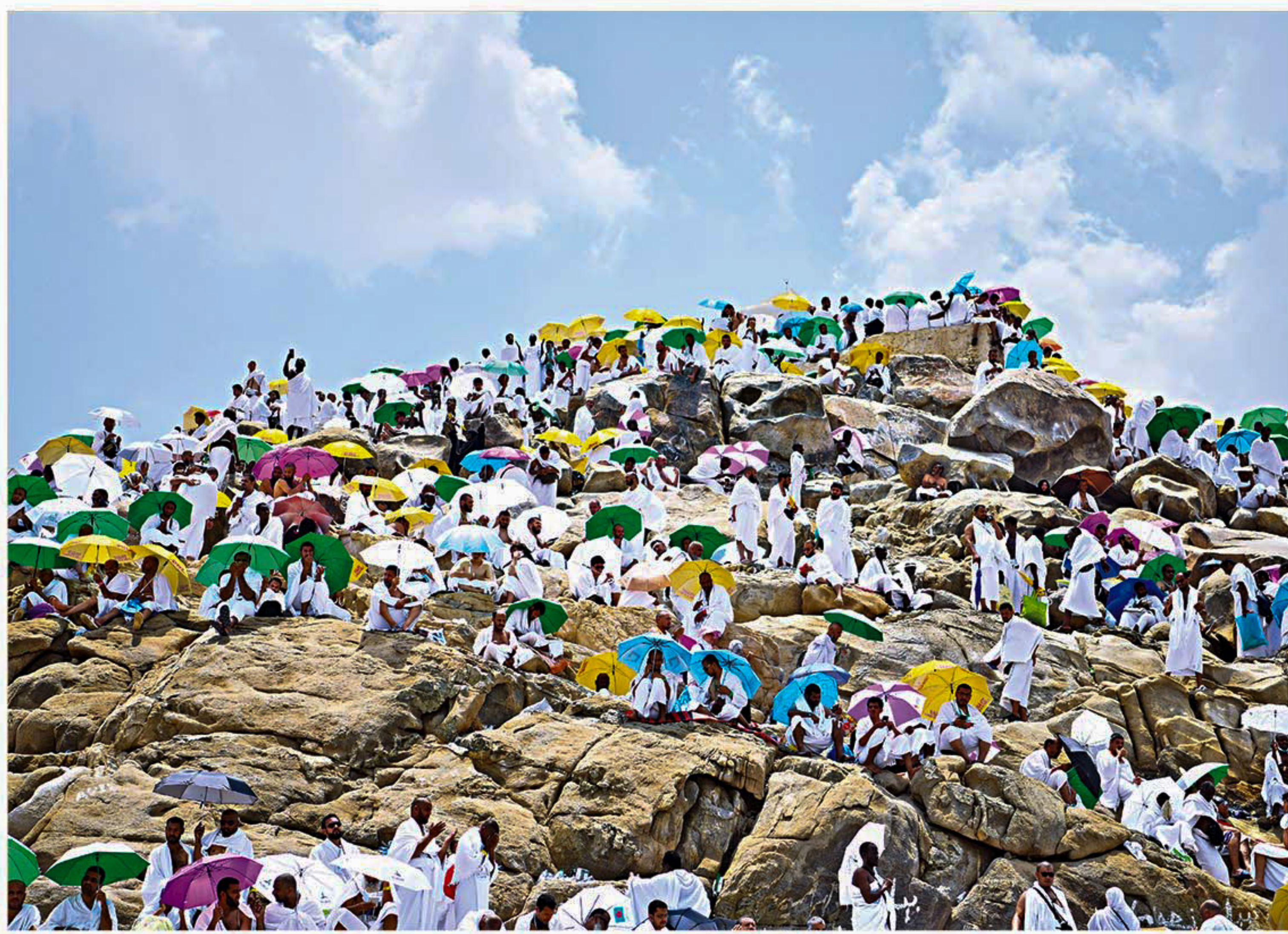
Muslim pilgrims pray on the Mount of Mercy in Arafat ahead of the Eid al-Azha festival in the holy city of Makkah, Saudi Arabia yesterday.