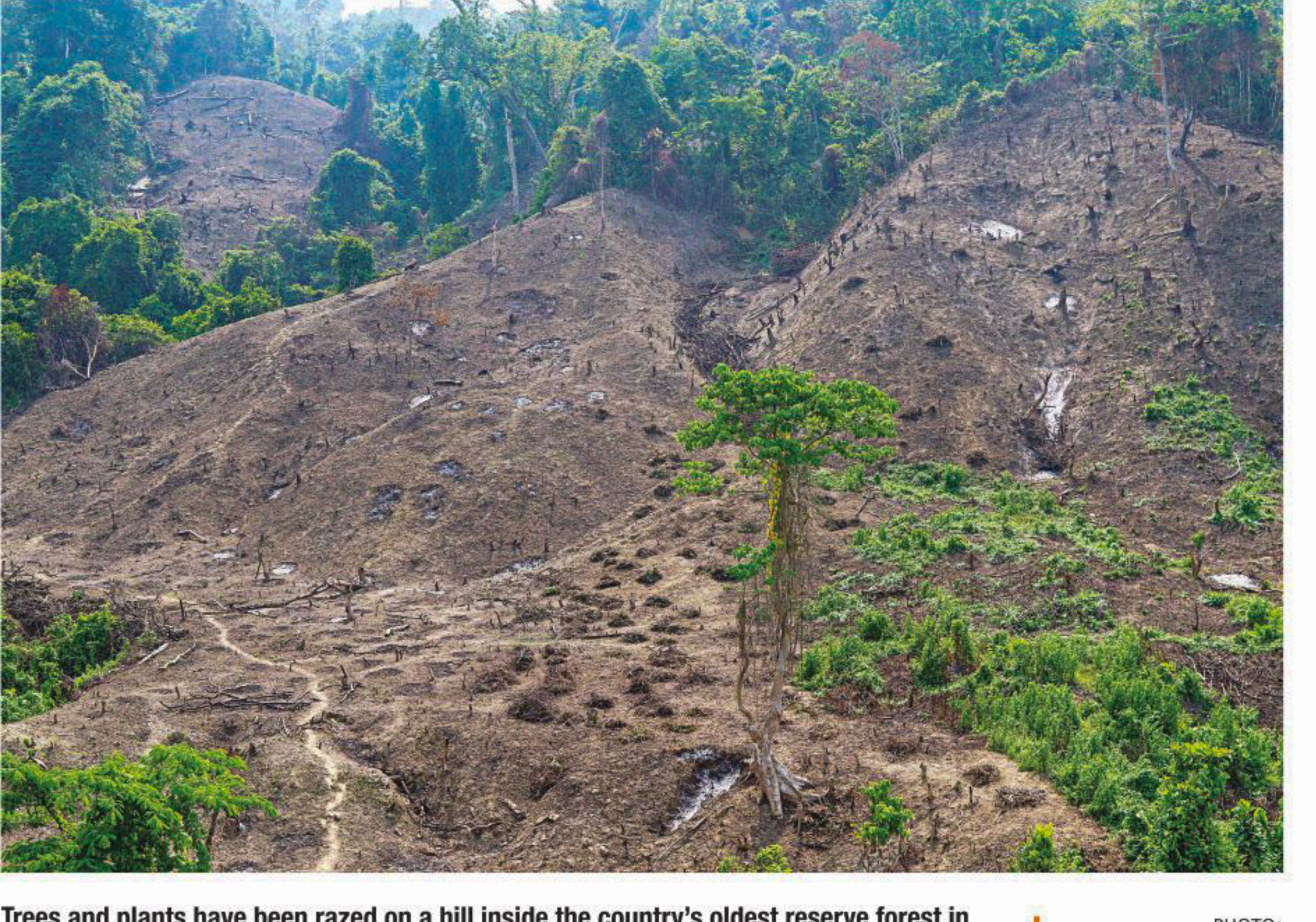
Trees and plants have been razed on a hill inside the country's oldest reserve forest in Kaptai upazila of Rangamati.

10 others hurt in the chaos in Phulpur OUR CORRESPONDENT, Mymensingh A VGF (Vulnerable Group Feeding) card seeker was killed and 10 others injured when a chaotic situation broke out during the distribution of the cards and VGF rice yesterday afternoon. The incident took place at Phulpur Mohila Degree College venue in Mymensingh. SEE PAGE 5 COL 2