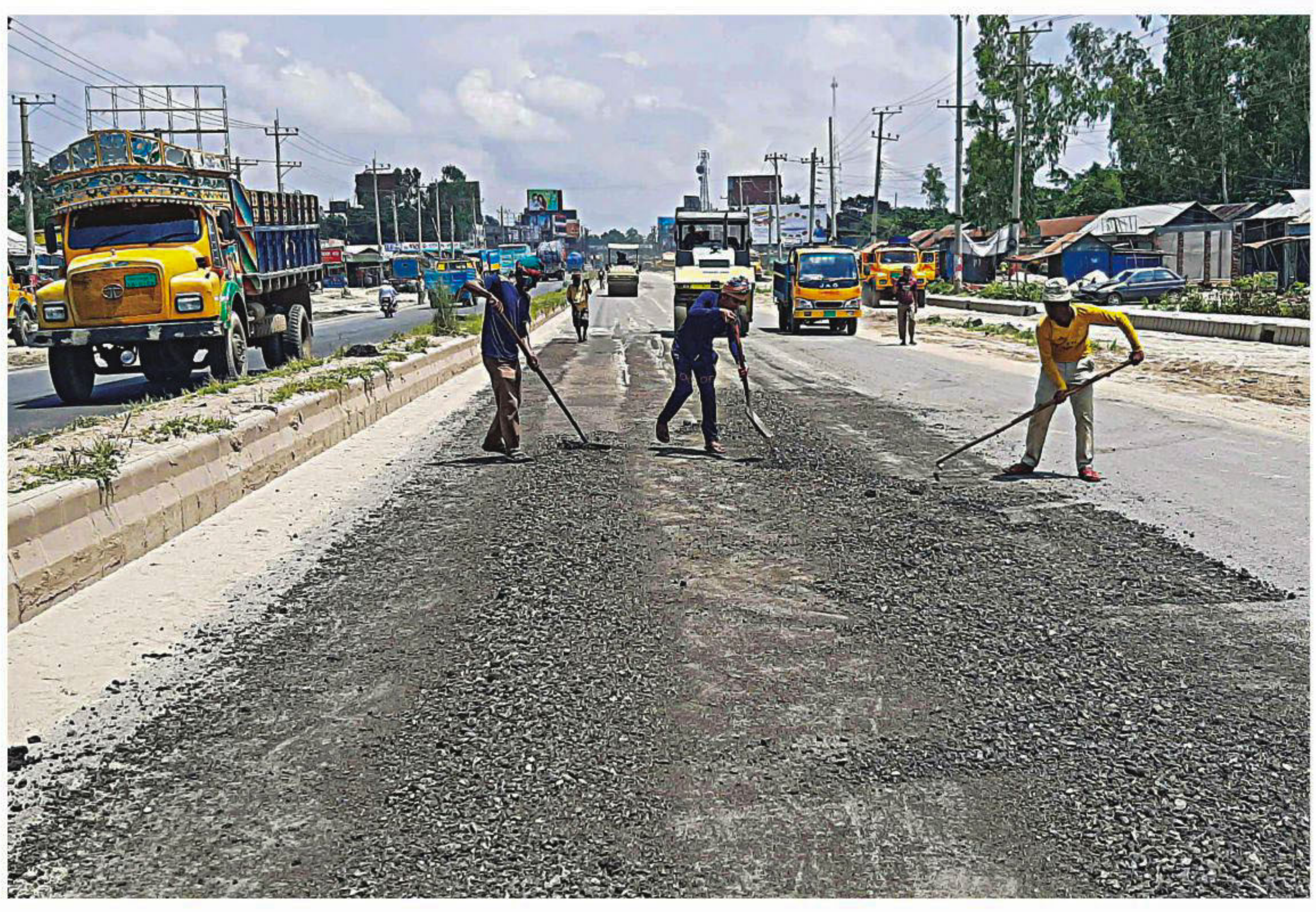
Workers repair the grooves created by the continuous plying of heavy vehicles on Dhaka-Tangail highway at Elenga. Eid holidaymakers fear there would be a lot of traffic jams and bottlenecks on this highway during the Eid rush.