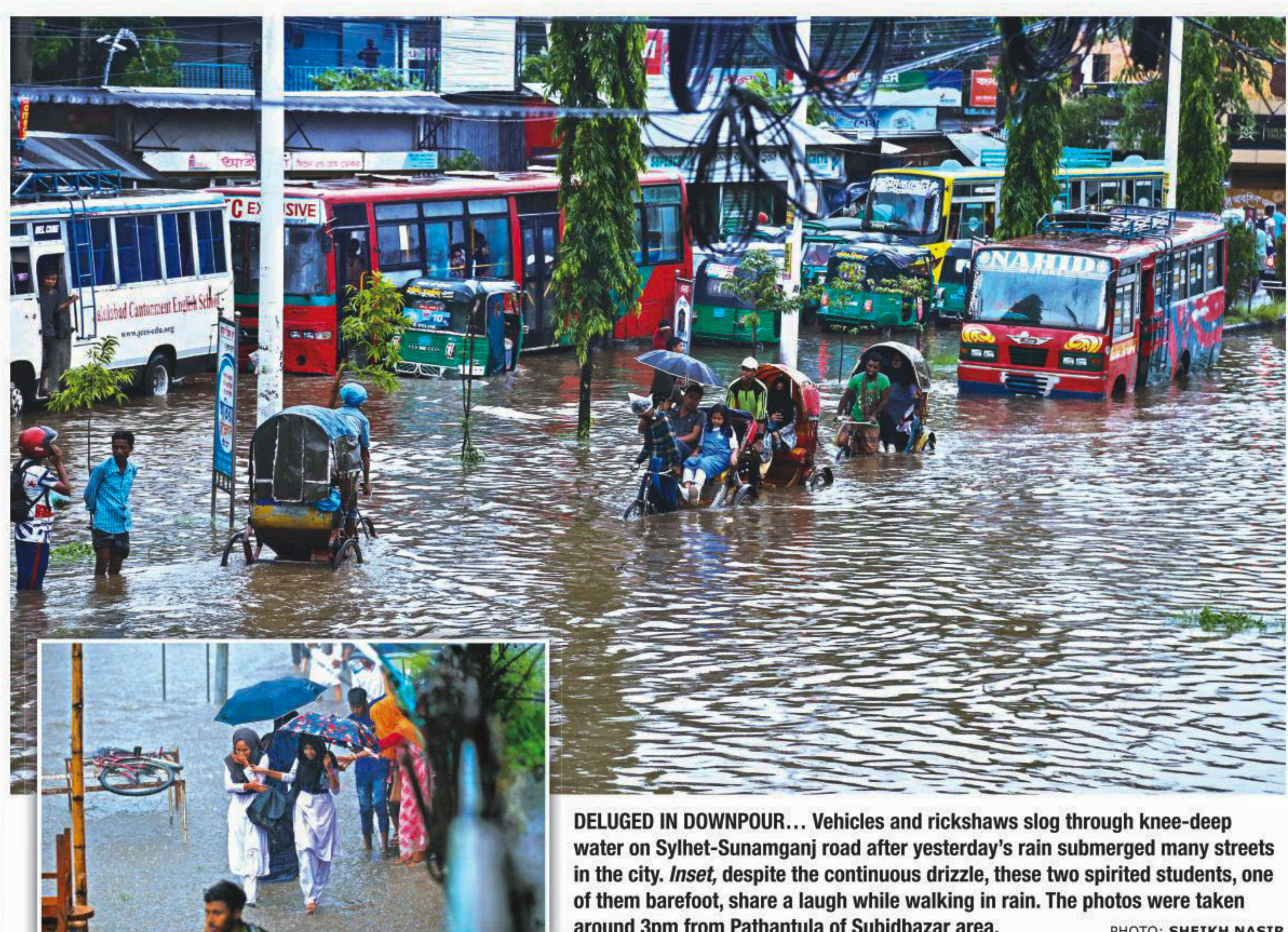
DELUGED IN DOWNPOUR... Vehicles and rickshaws slog through knee-deep water on Sylhet-Sunamganj road after yesterday's rain submerged many streets in the city. Inset , despite the continuous drizzle, these two spirited students, one of them barefoot, share a laugh while walking in rain. The photos were taken around 3pm from Pathantula of Subidbazar area.