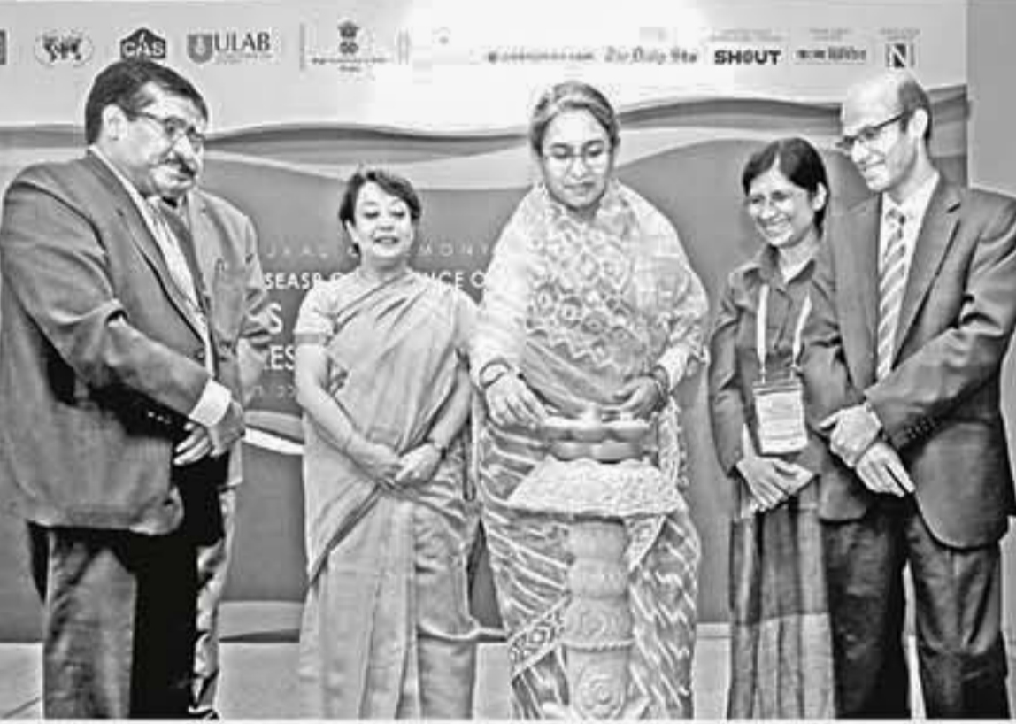
Education Minister Dr Dipu Moni inaugurated the conference yesterday.