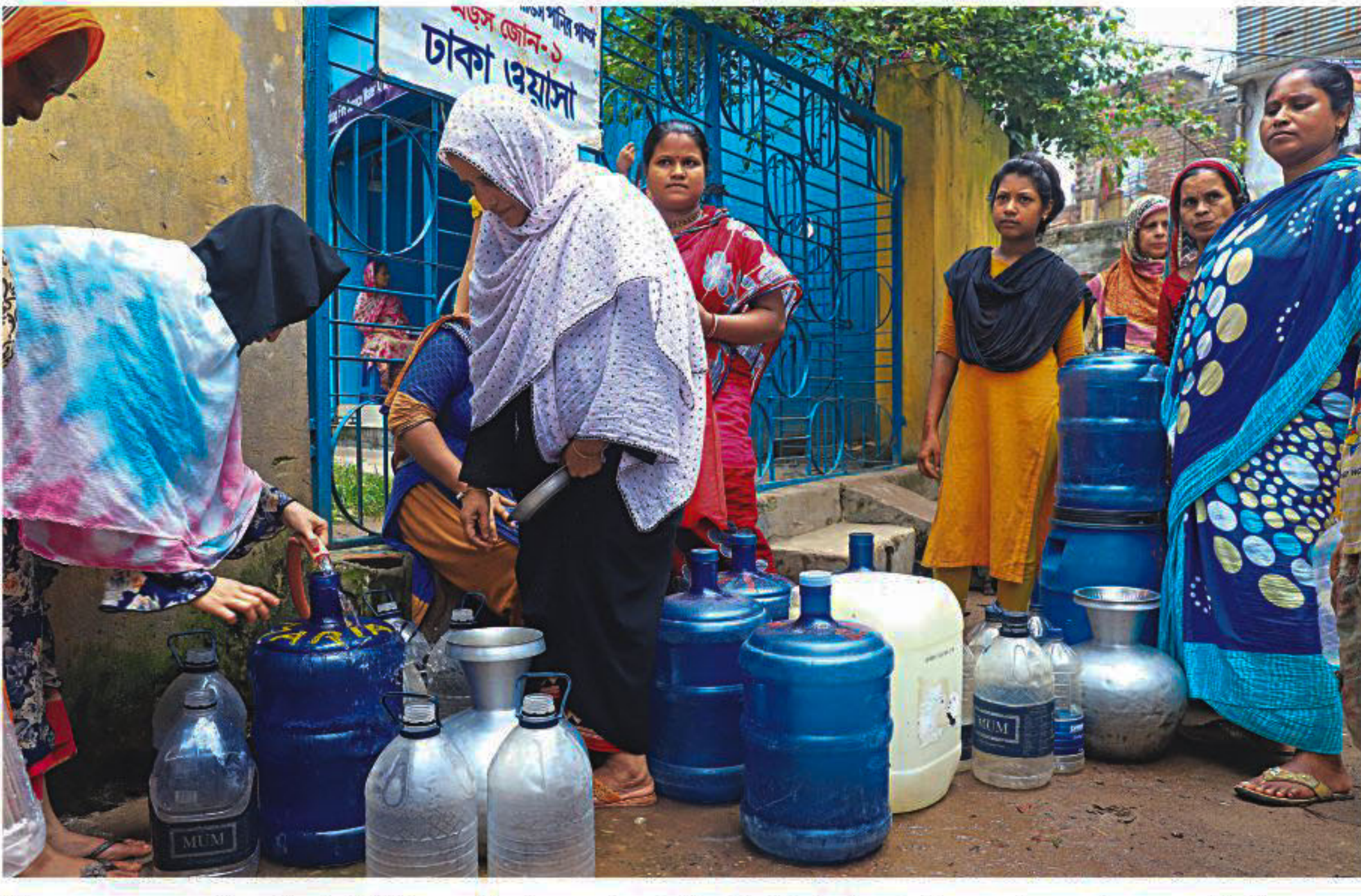
Women queue up to collect drinking water from a tap in front of Golapbagh fire service water pump in the capital yesterday. They have to bear the hardship of carrying the water containers as they cannot drink polluted water of Dhaka Wasa supplied to their homes.

ANWAR ALI, Rajshahi It's a cancer hospital and research centre, but it treats far more general patients than those with cancer. Its 45 beds are almost always empty while all its modern machines remain mostly unused. This four-storey specialised hospital in Rajshahi's Shyampur has eight doctors, but no permanent oncologist and they pay visits to the hospital only on call. Over the last five months, The Daily Star visited the hospital five times and found no patients on four occasions. On another occasion, three "patients" were found occupying three beds, but subsequent investigation revealed none of them had cancer. A source familiar with the workings of the hospital said the authorities used the facility to bring in foreign donation. The authorities denied the claim. The hospital in question, Rajshahi Cancer Hospital and Research Centre, was built between 2000 and 2007 with foreign funds -- mostly from Kristiansand Kommune of Norway and the Rotary International, according to its website. It has 26 staff members, including eight part-time doctors, four nurses, and two laboratory technicians, none of whom are permanent and have little or no expertise in the field of cancer, sources have said. Last year, the hospital treated over 8,000 diabetes patients when only 146 cancer patients took treatment there, hospital records show. THE FAKE CANCER PATIENTS On the second visit on January 26, the hospital authorities led this correspondent to three "cancer patients". SEE PAGE 9 COL 1