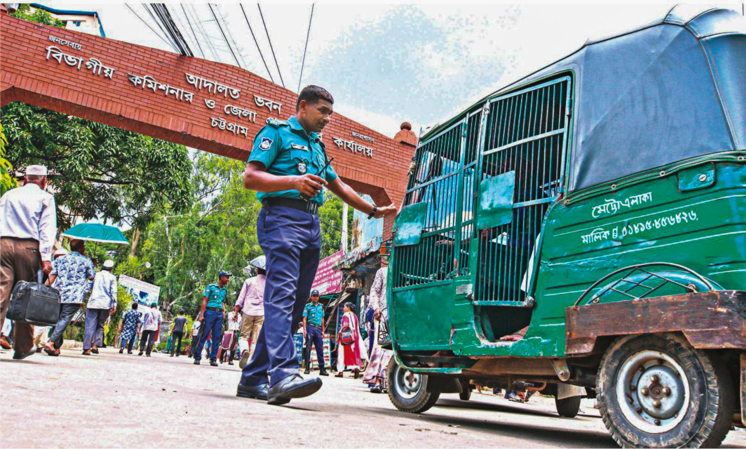
A police official inspects an auto-rickshaw in front of Chattogram metropolitan court yesterday morning. Security measures were heightened in the area as imprisoned militant suspects were brought to the court for hearings.