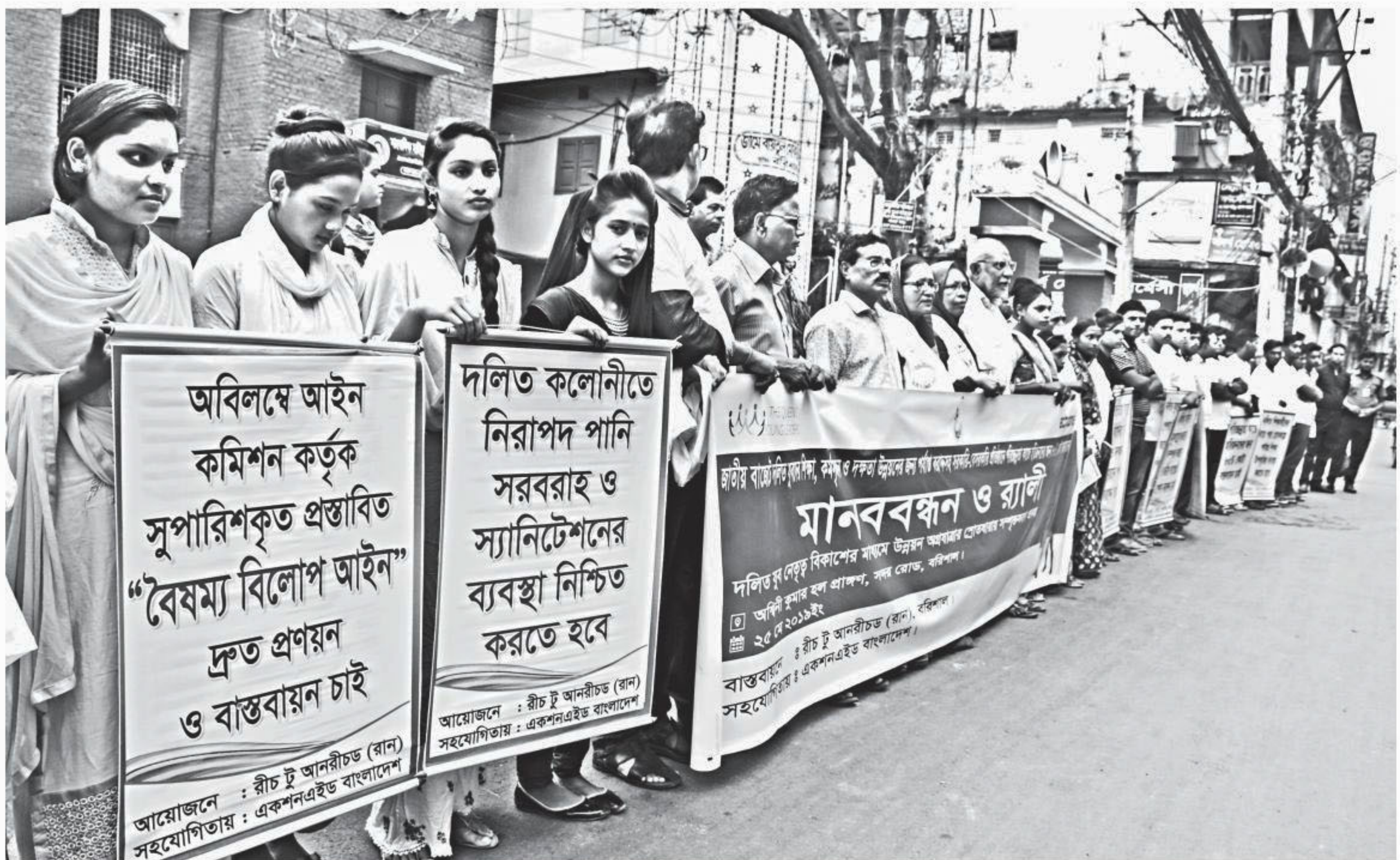
With a 14-point demand including allocation for Dalit youths' skill development in the national budget, Reach to Unreached formed a human chain on Barishal city's Sadar Road yesterday.