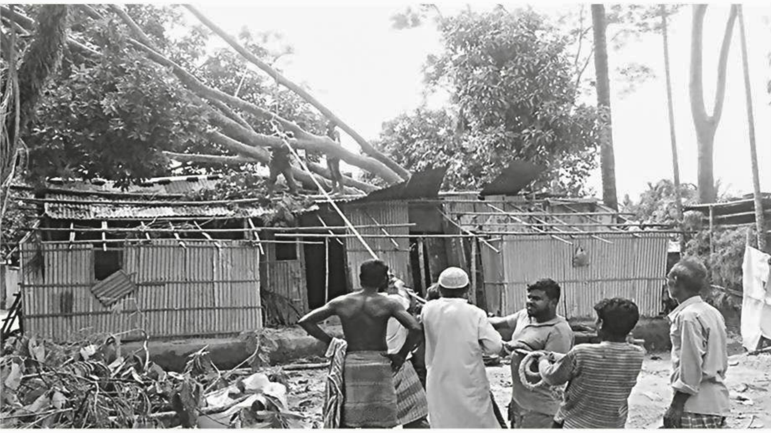
People trying to remove a tree that toppled over a house during a storm on Saturday night. The photo was taken in Bananipara area of Sunamganj Sadar on Sunday.