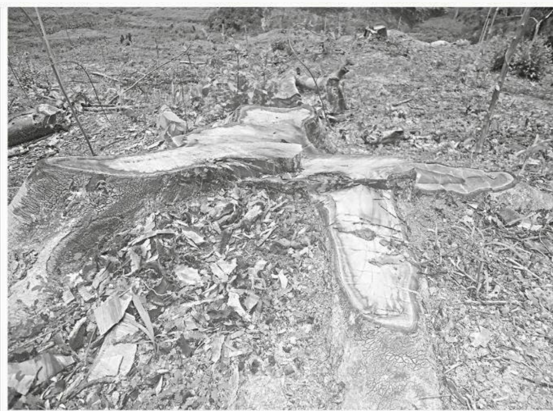
Remains of trunks bear testimony to the felling of around 400 trees at Meghla tourist spot in Bandarban in last one month.