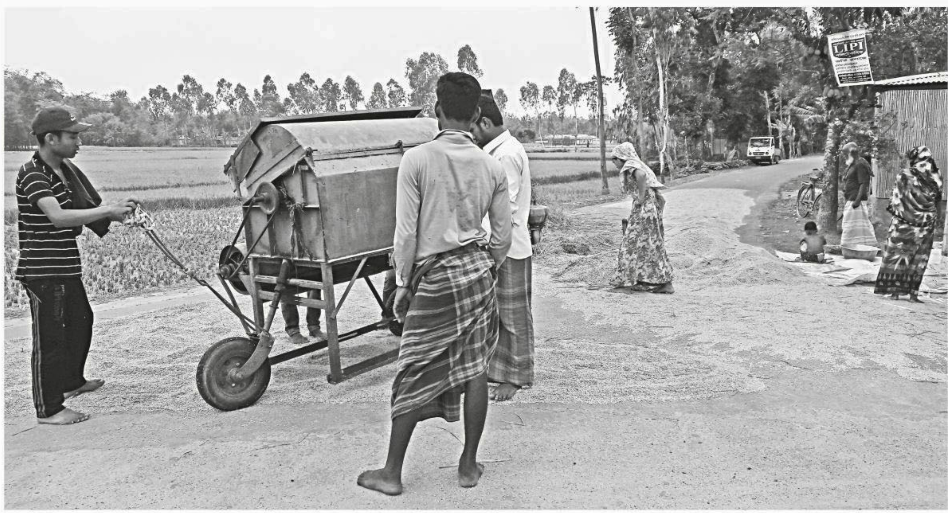
Farmers are seen busy processing their harvested paddy on Lalmonirhat-Hatibandha road. The photo was taken from Daikhawa area in Lalmonirhat's Hatibandha upazila on Saturday.