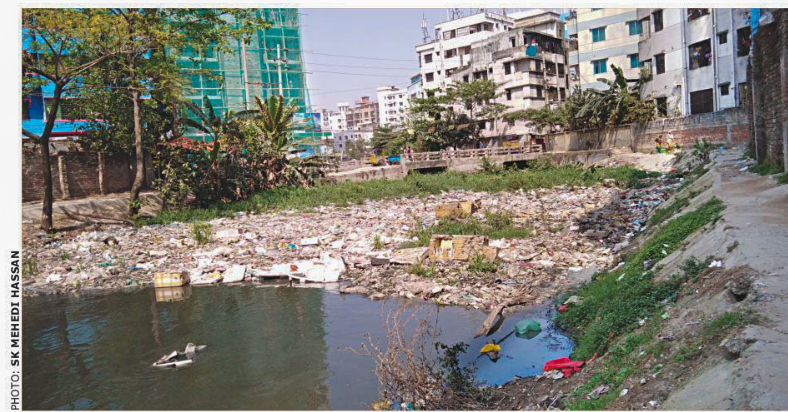
Ramchandrapur Khal, supervised by Dhaka Wasa, is clogged with solid and liquid waste -- a result of unawareness. With no cleaning drive for months, such a situation may create waterlogging during the upcoming monsoon. Besides, the canal has turned into a mosquito breeding ground. The photo was taken in Mohammadpur area recently.

They were handed over to Bandar Police Station. A case was filed.