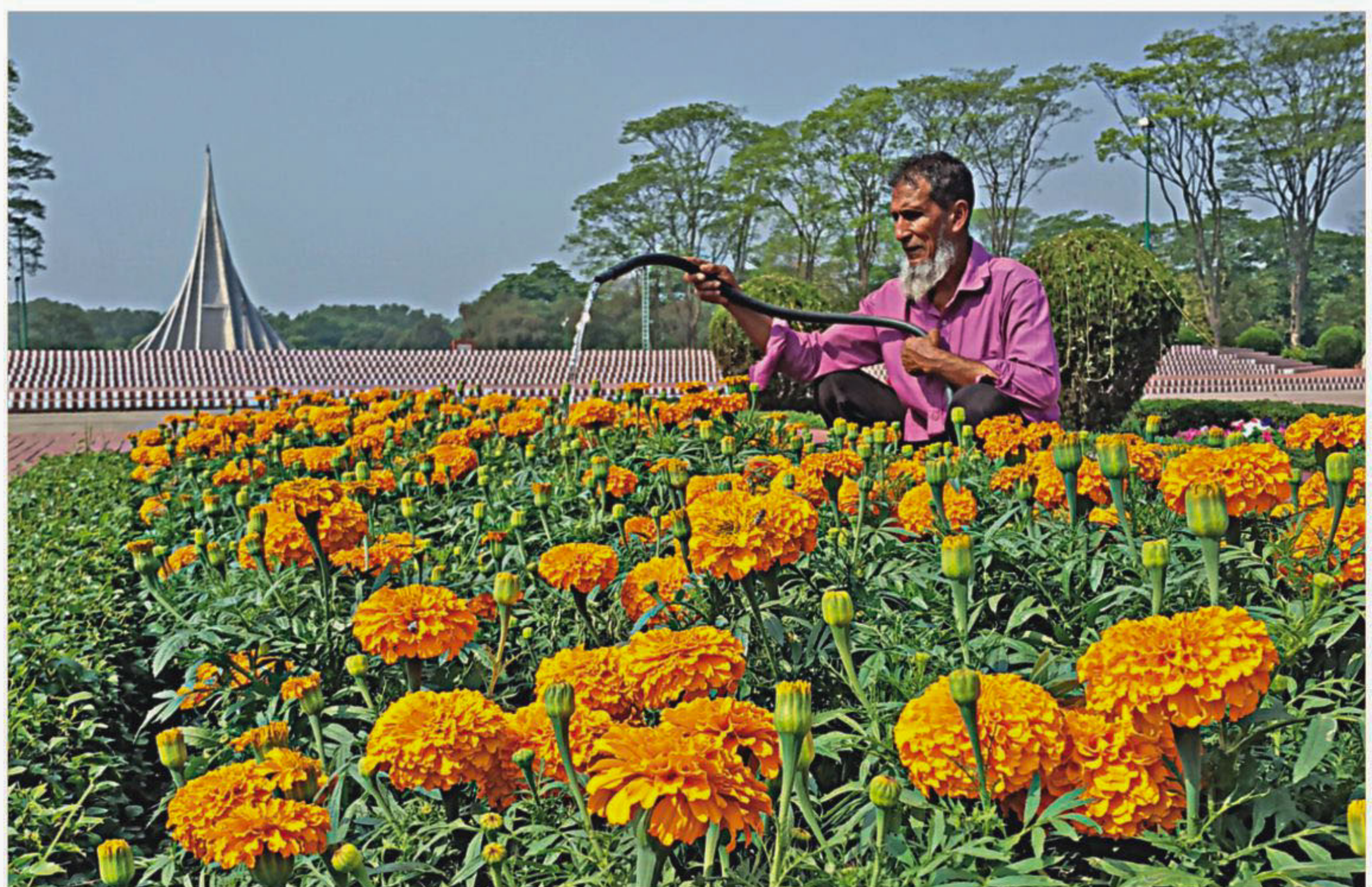
Ahead of Independence Day, workers are sprucing up National Martyrs' Memorial in Savar. Visitors from all walks of life will visit the monument to pay their respect on March 26. The photo was taken yesterday.

Dr Khan graduated from BUET in 1972, and obtained his PhD from University of Illinois in 1979. He has been contributing to The Daily Star for over 20 years.