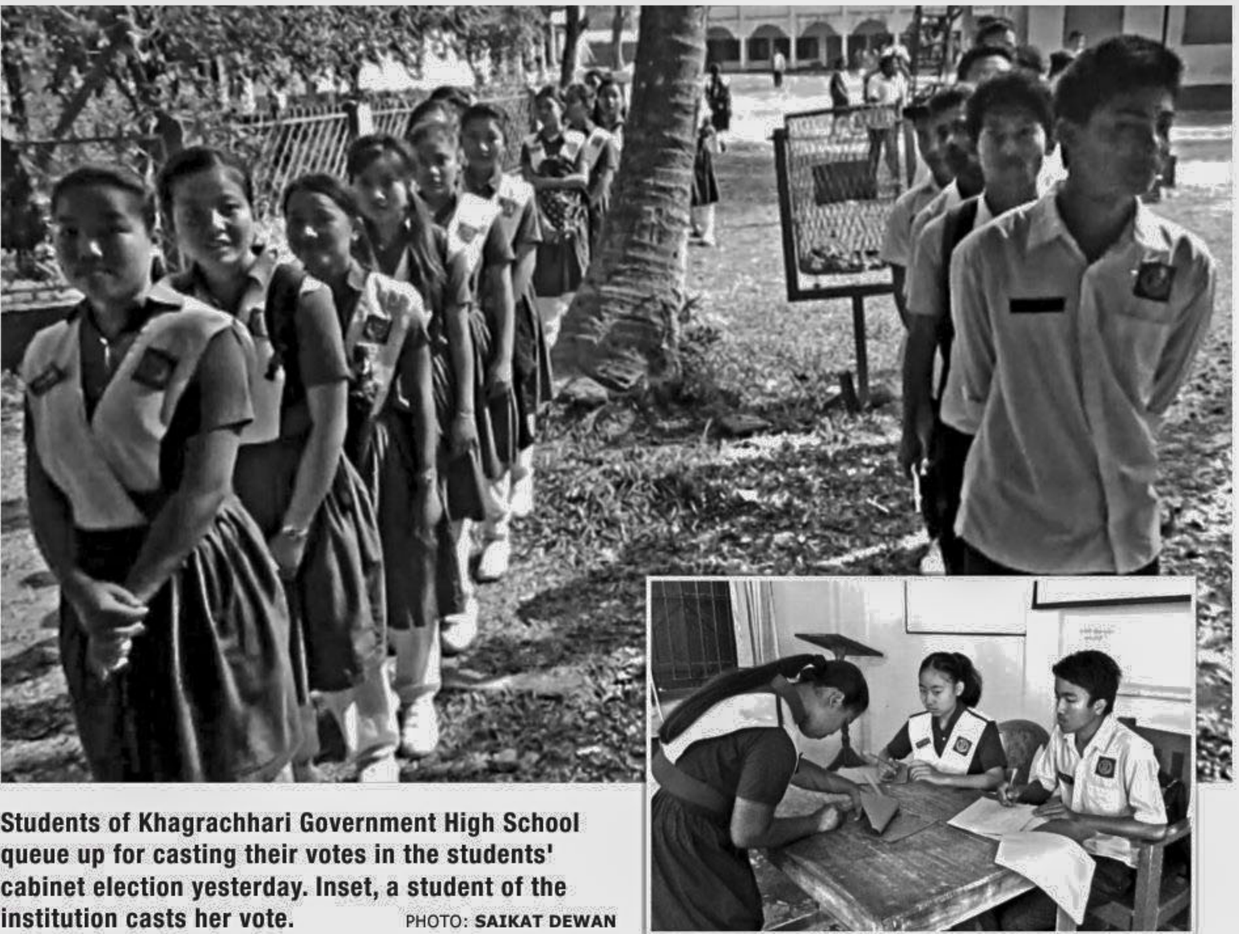
Students of Khagrachhari Government High School queue up for casting their votes in the students' cabinet election yesterday. Inset, a student of the institution casts her vote.