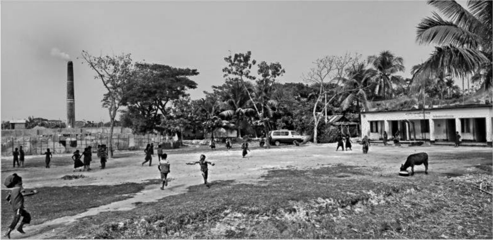
A brick kiln runs just beside Sabdul Sarker Government Primary School at Mandipur village in Gouripur upazila of Mymensingh, posing health hazard for kids as well as locals.