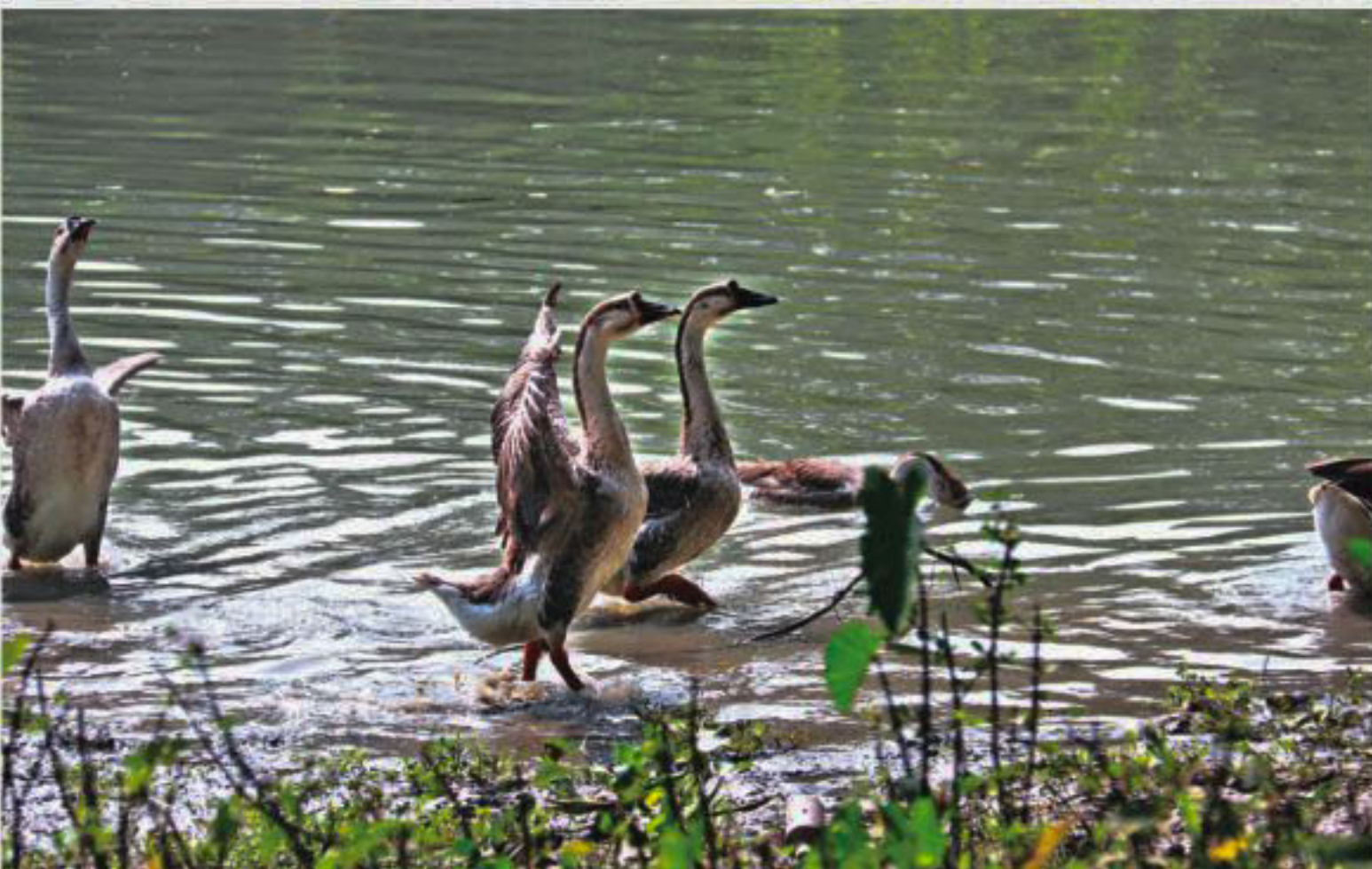
A flock of geese bathe in Sagordi canal, left, and a boat plies on the waterbody. This tranquil scenery exists because the canal exists. The photos were taken recently.

Although most of the canals in Barishal -- a city once known for its waterbodies -- are dead or grabbed, a few still exist. The last part of the series focuses on those.