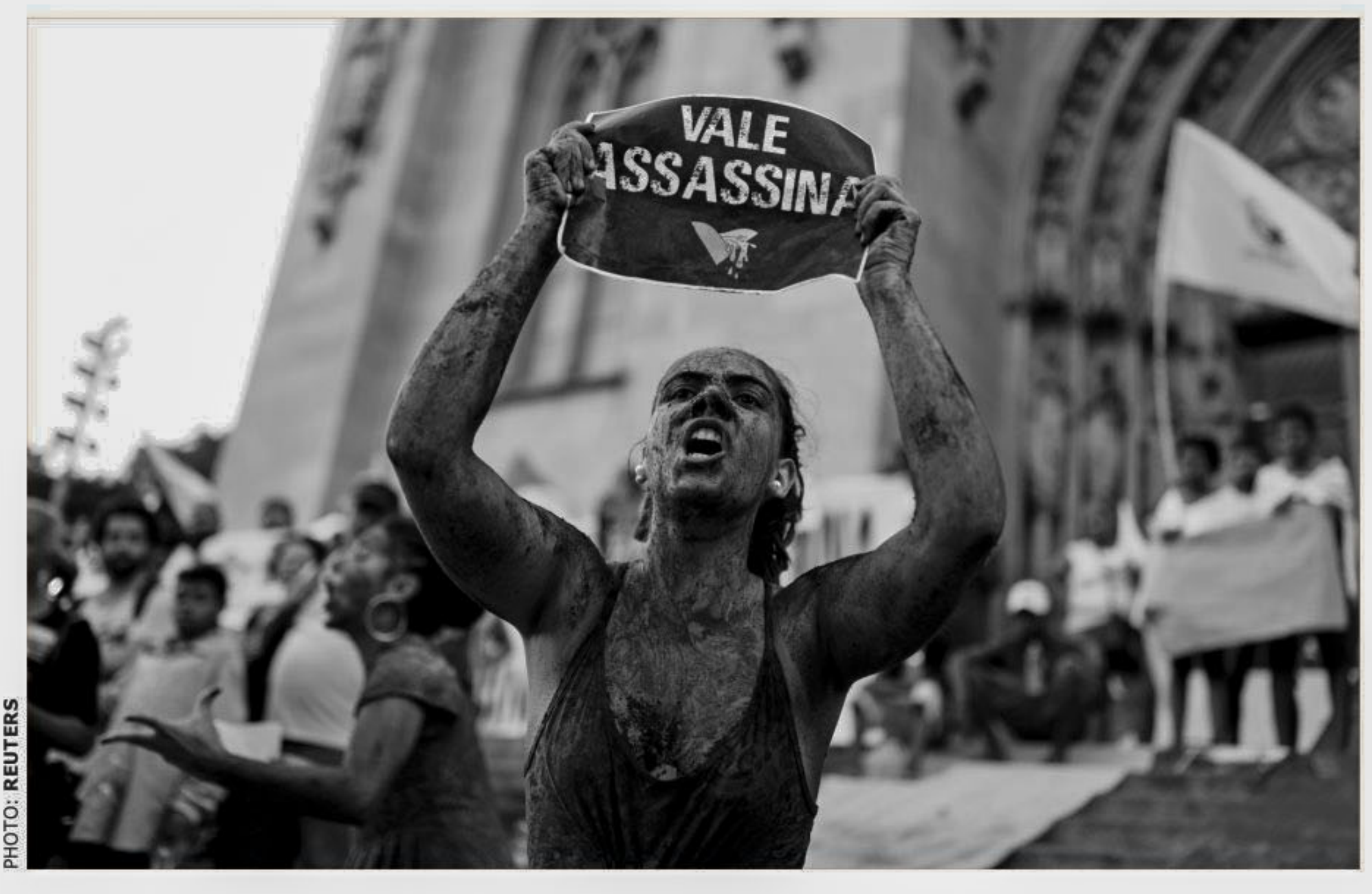
An activist covered in mud, holds a sign reading "VALE SA, Killer!" during a protest against the Brazilian mining company Vale SA, in front of the Se Cathedral in Sao Paulo, Brazil, on Friday. The collapse of a Brazilian dam controlled by miner Vale a week ago likely happened because parts of the sand and dried-mud structure dissolved into liquid, a state regulator said in an interview, similar to what caused another deadly mining disaster less than four years ago. With 115 people confirmed dead and another 248 missing, according to information from the rescue team on Friday evening, the dam collapse in the town of Brumadinho could be Brazil's deadliest mine disaster.

Indian Prime Minister Narendra Modi launched a scathing attack on West Bengal Chief Minister Mamata Banerjee, who is making efforts to bring together opposition parties to fight the BJP in the upcoming national election, due in about three months. At a rally in West Bengal's Durgapur, Modi accused the Trinamool chief of "strangling democracy in Bengal". The PM, who launched the BJP's campaign in the state, said that the people of Bengal want a "parivartan (change)" and are determined to throw Mamata Banerjee. Modi alleged that Mamata was treading the path of the previous communist government to trample democracy. "She should know it did not