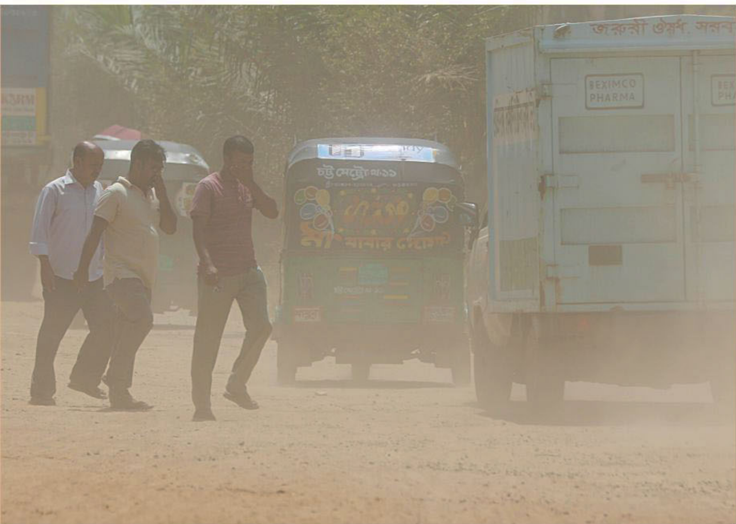
Pedestrians cover their mouths and noses as they cross the Port Connecting Road at Halishahar Wapda in Chattogram city through a cloud of dust kicked up by passing vehicles. Inset, a woman covers the mouth and nose of her child as they travel on a motorbike there. Development work on the road is blamed for the public suffering.