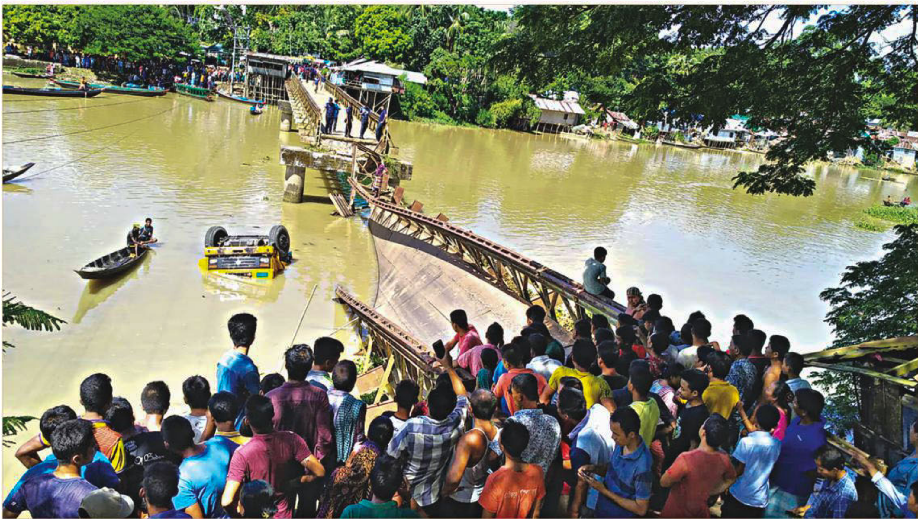
A collapsed Bailey bridge over the Changi river in Mahalchhari upazila of Khagrachhari. Part of a submerged stone-laden truck, which was on the bridge when it collapsed, is also seen. One of five labourers travelling on the vehicle drowned.