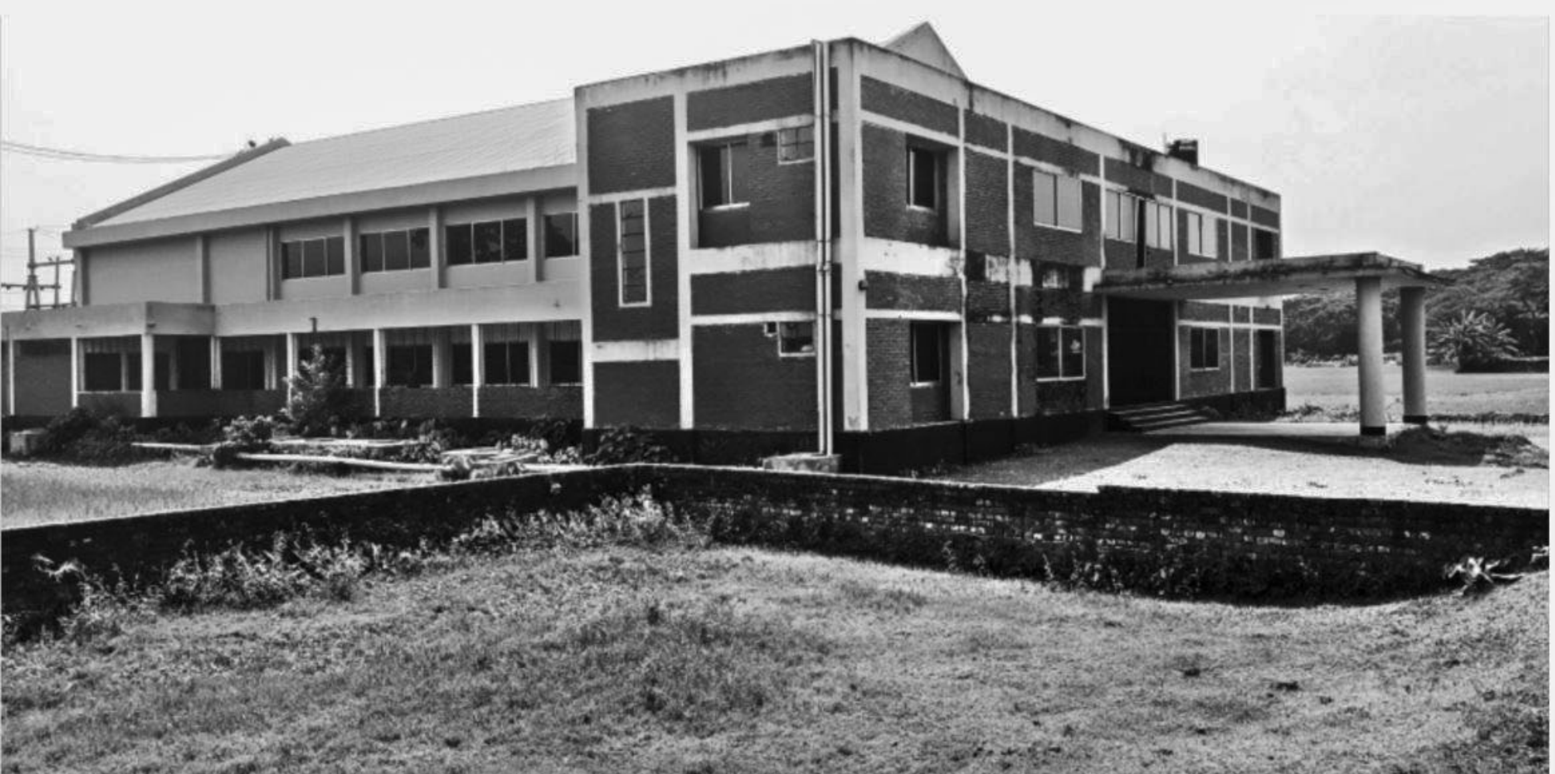
Two years after completion, this impressive building of the auditorium cum community centre in Ishwarganj upazila of Mymensingh is yet to be opened for use due to absence of a connecting road.