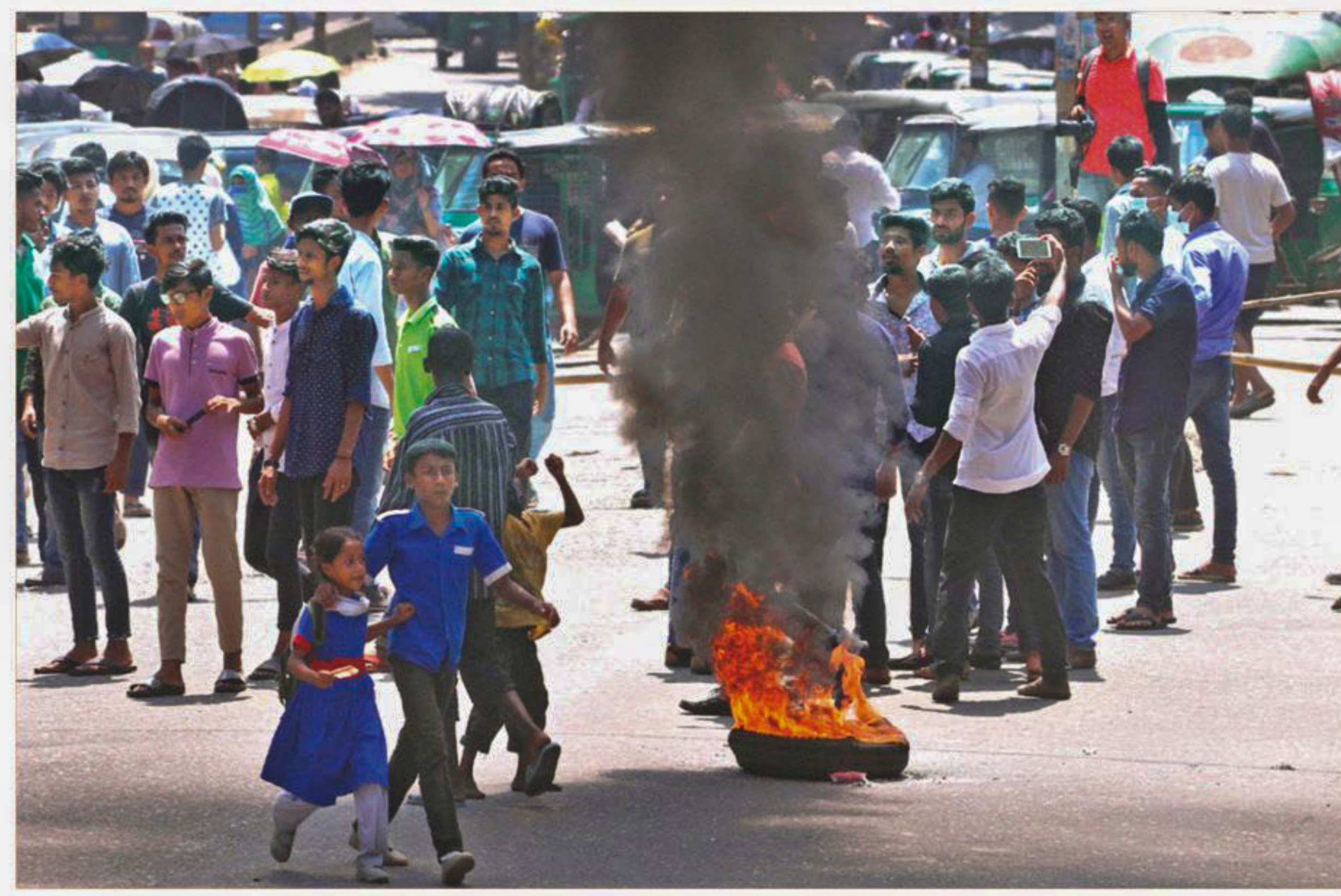
Two minors walk past a burning tyre set afire by a group of BCL activists of Chittagong Government College unit yesterday, demanding cancellation of its newly-formed committee. They also blocked College Road, blasted crude bombs and vandalised vehicles.