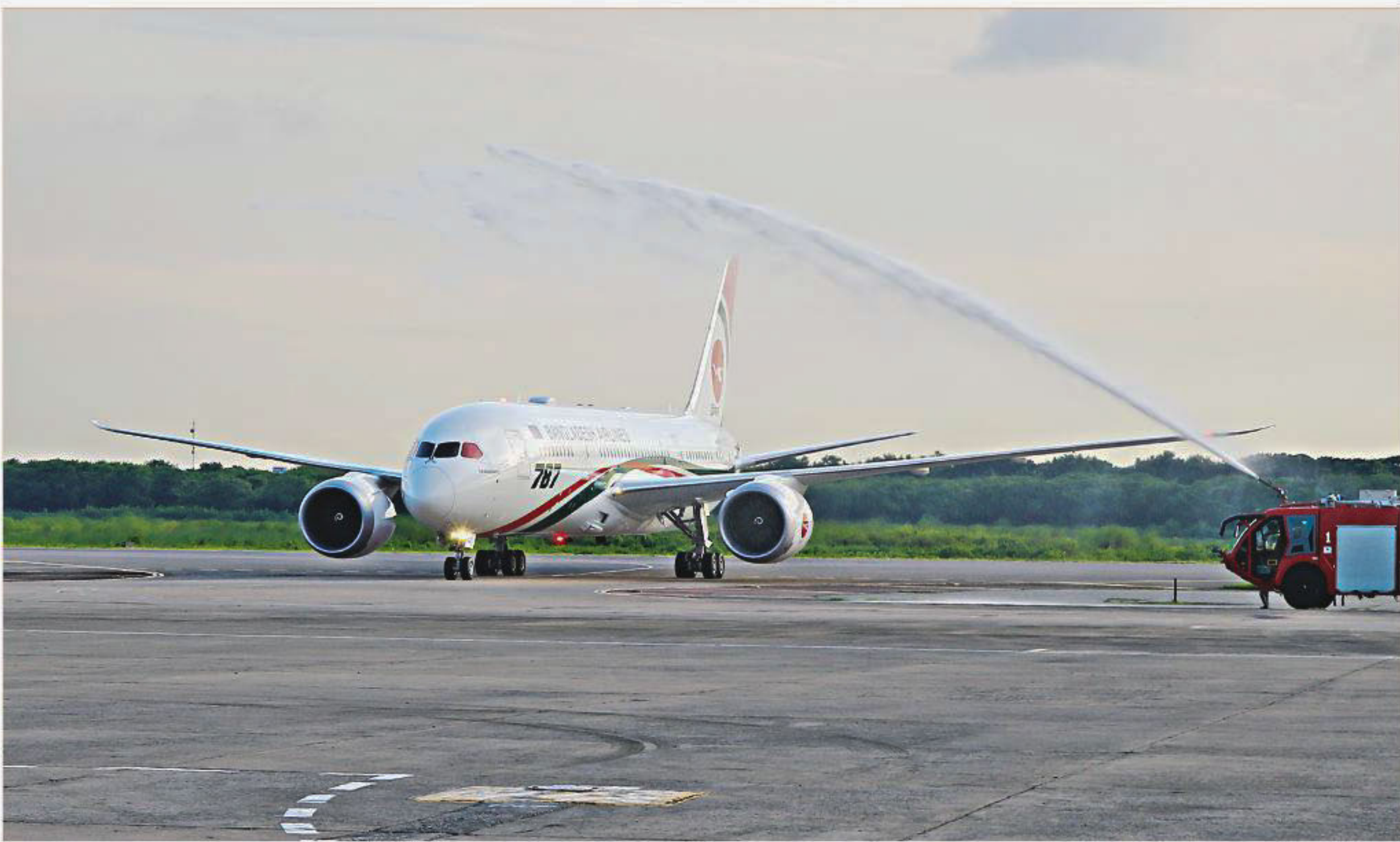
Biman Bangladesh Airlines' first Boeing 787-8 Dreamliner gets a water salute on arrival at Hazrat Shahjalal International Airport yesterday. The aircraft has been christened "Akashbeena" by Prime Minister Sheikh Hasina.