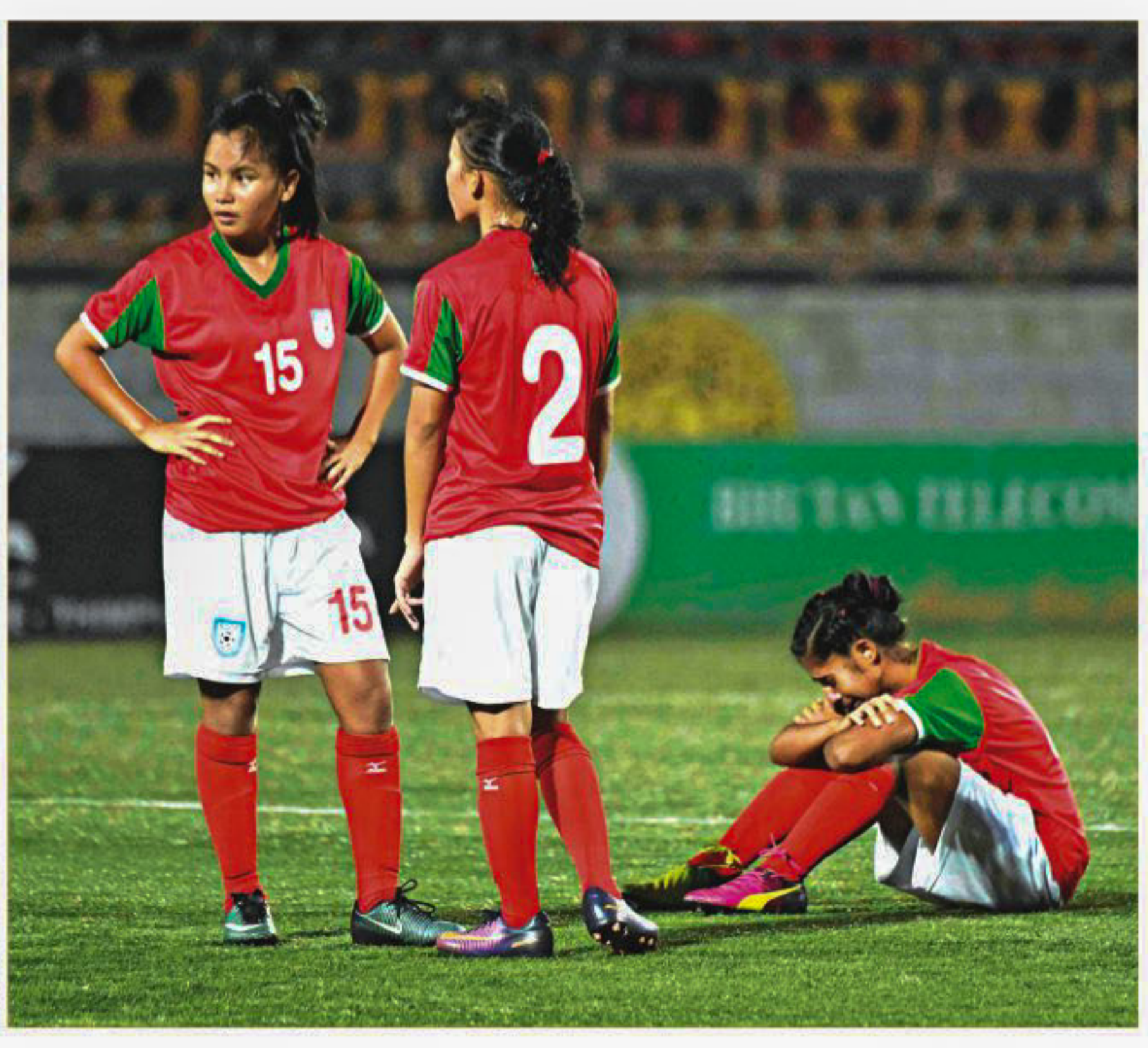
The mood of the Bangladesh girls is quite understandable after their shock 1-0 defeat against India in the SAFF Women's Under-15 Championship final at the Changlimithang Stadium in Thimphu yesterday.

Defending champions Bangladesh put up a below-par performance in the final of the SAFF U-15 Women's Championship as they suffered a 1-0 defeat to India at the Changlimithang Stadium in Thimphu yesterday. The defeat meant that the girls in red and green lost their stranglehold on the region's football to neighbouring India, who avenged their 1-0 defeat to Bangladesh in last edition's final in Dhaka last December. The victory also saw India stop their losing streak to Bangladesh, who defeated the Indian U-14 and U-15 teams twice each in 2016 and 2017. Meanwhile, SEE PAGE 13 COL 4