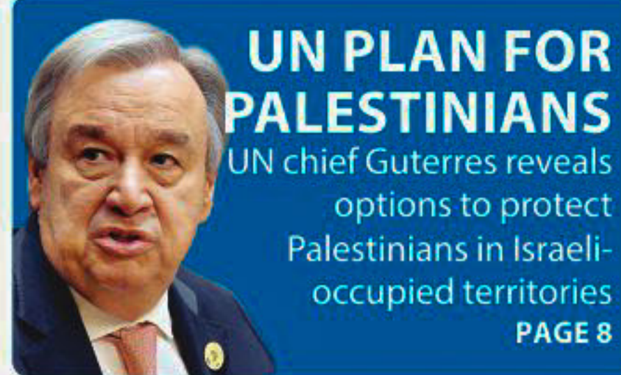
UN PLAN FOR PALESTINIANS UN chief Guterres reveals options to protect Palestinians in Israeli-occupied territories PAGE 8