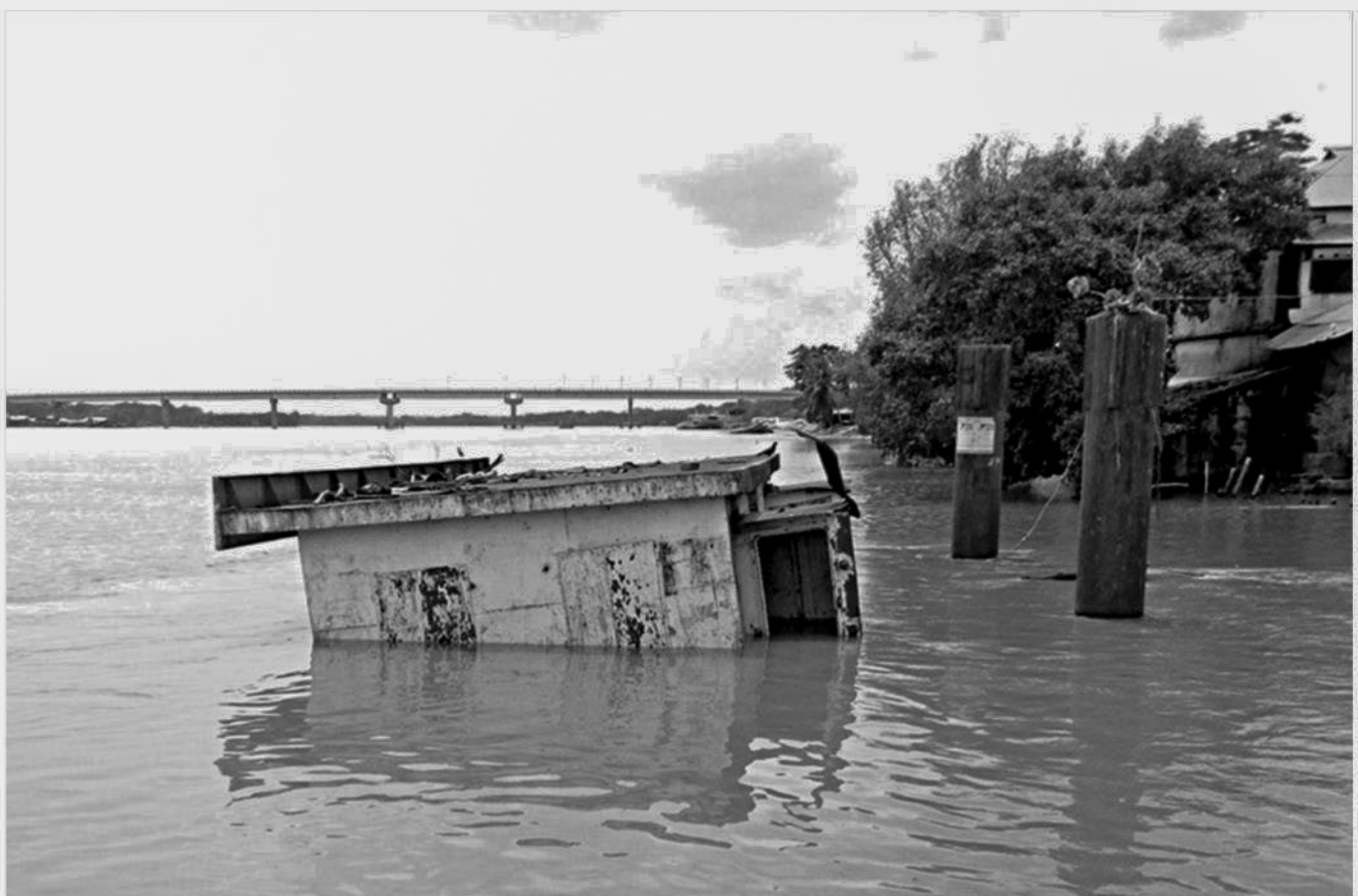
The pontoon at Kalapara launch terminal in Kalapara town of Tangail sank around six months ago, forcing launches to anchor at another place.