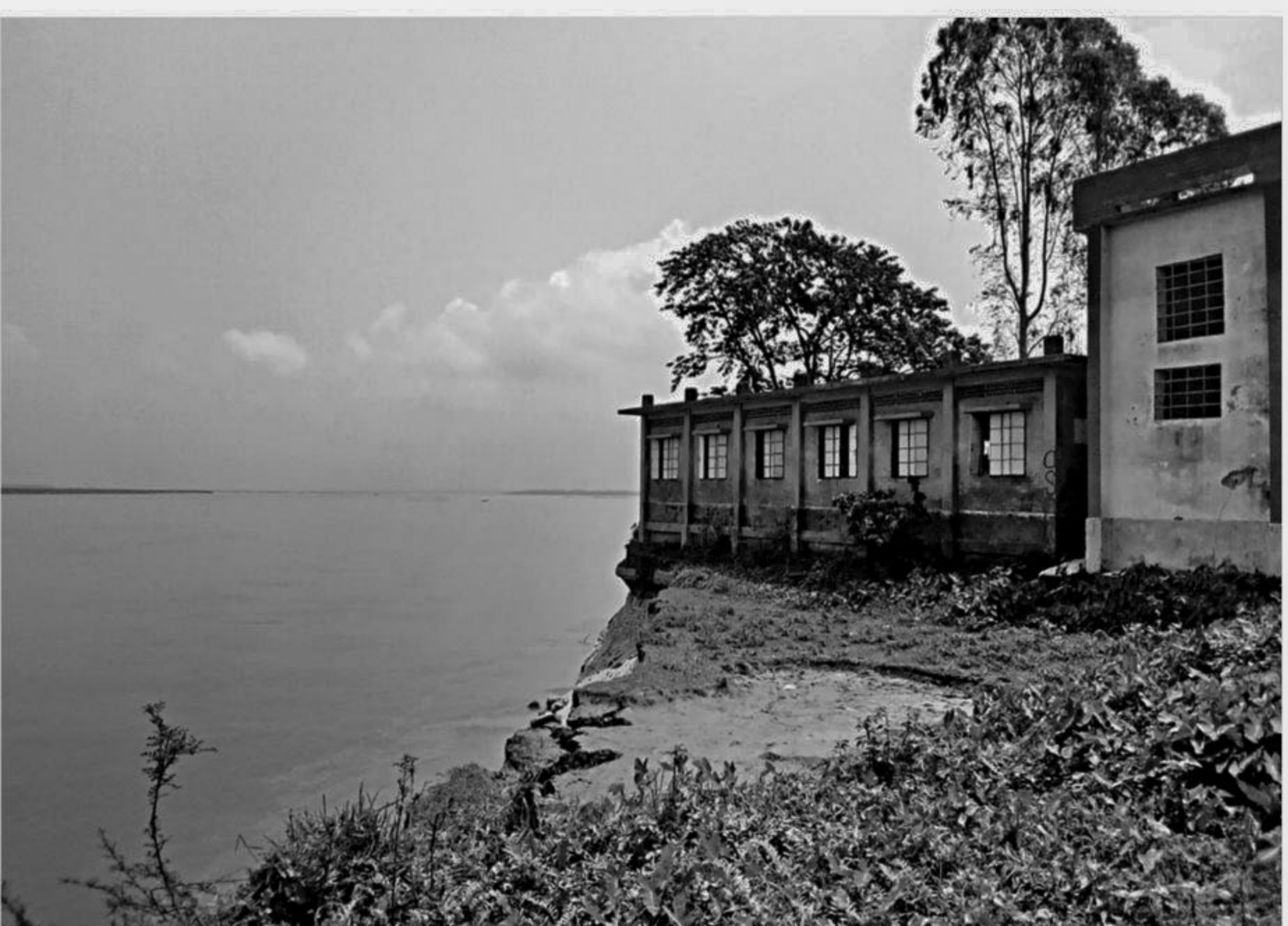
Bachamara Uttarakhand Government Primary School in Manikganj's Daulatpur upazila is now under threat of erosion by the river Jamuna. It may go into the river if the authorities concerned do not take immediate steps to prevent erosion. The school was established in 1969.

The kid's body was sent to Habiganj Sadar Hospital morgue for autopsy.