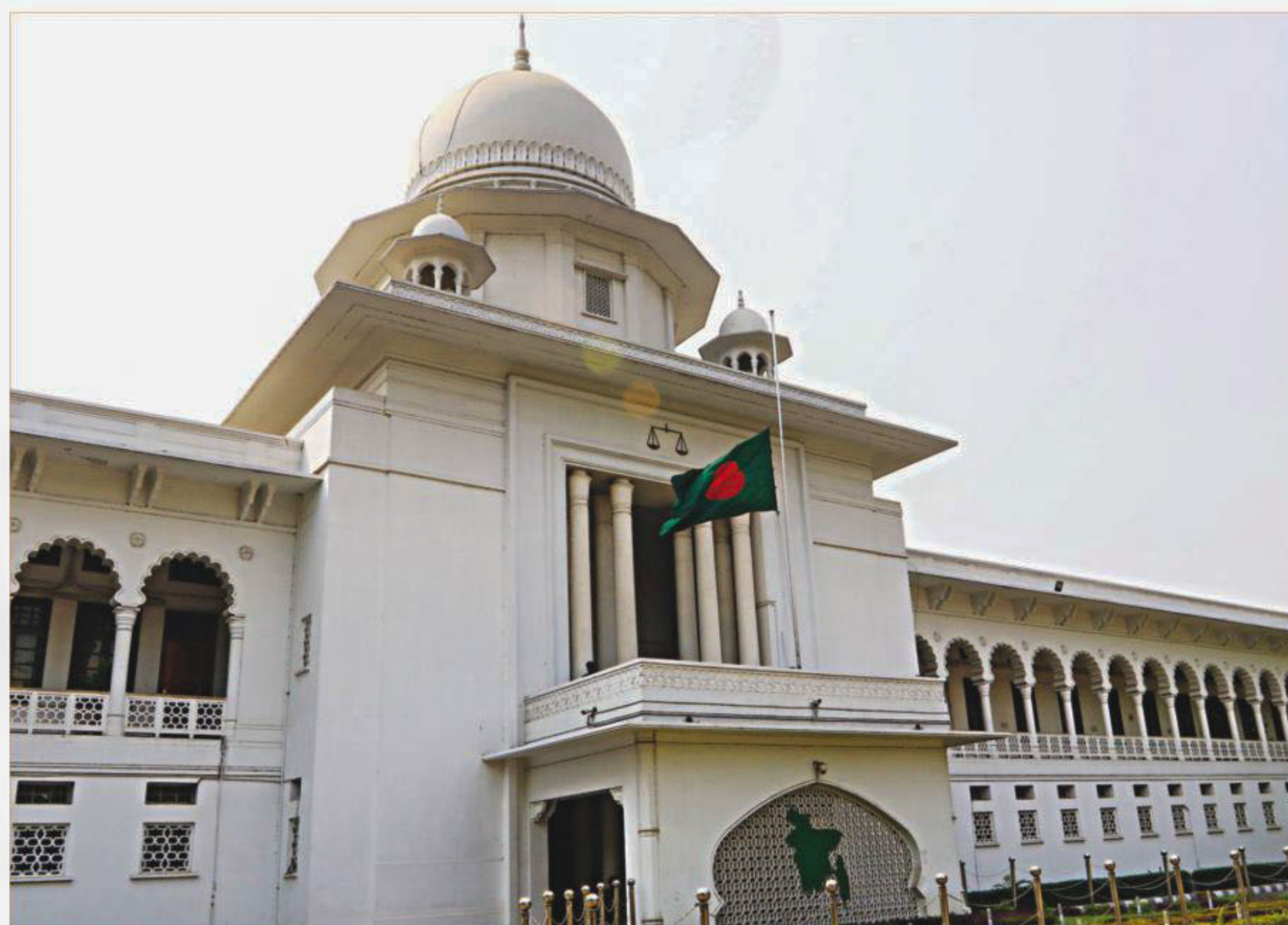
With the national flag hoisted half-mast across the country, the nation yesterday observed State Mourning Day to commemorate the victims of flight BS211 of US-Bangla Airlines. At least 49 people, including 26 Bangladeshis, were killed when the plane flying from Dhaka crashed in Kathmandu's Tribhuvan International Airport on Monday. The photo was taken at the Supreme Court building in the capital.

Earlier, in 2015, a Bangladeshi peacekeeper was killed and another sustained bullet injuries in the nation's capital Bamako.