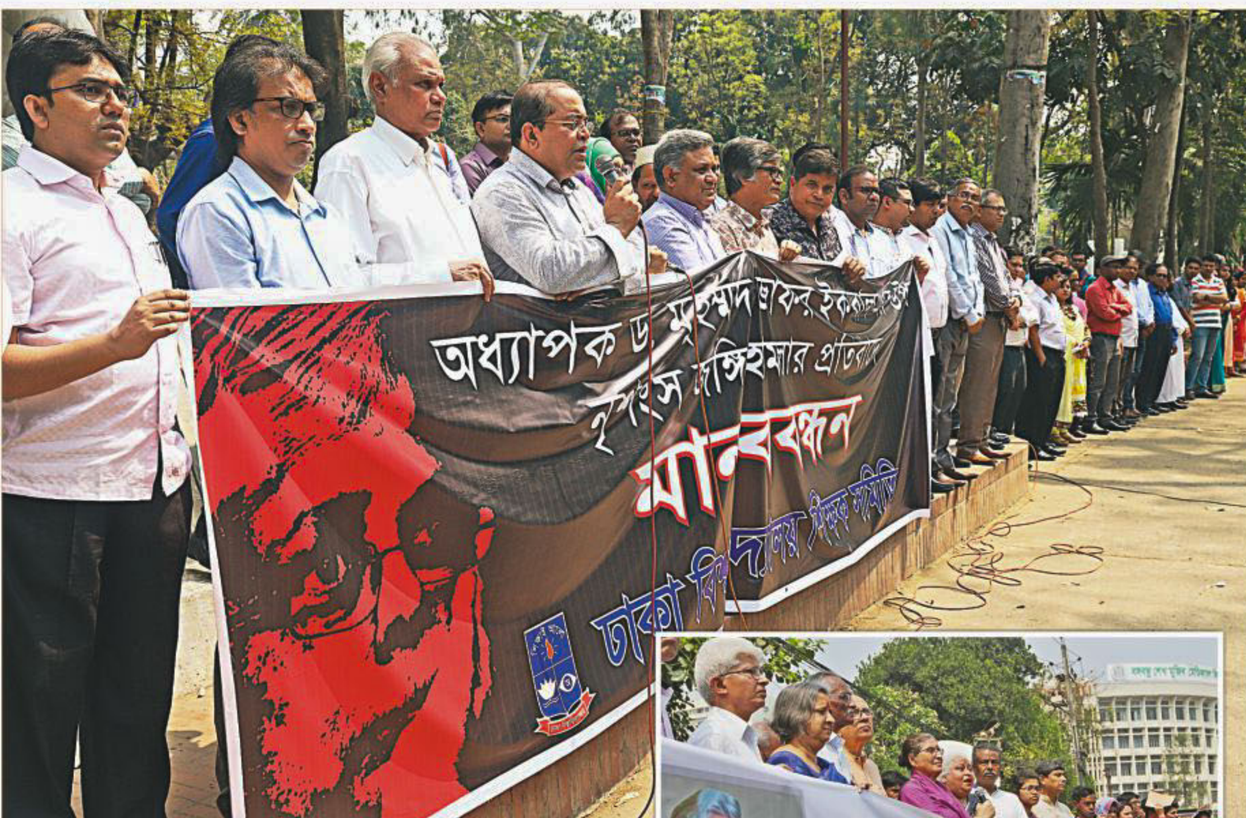
Dhaka University Teachers' Association forms a human chain on the university campus yesterday, protesting the attack on Prof Zafar Iqbal. Inset, Sammilito Samajik Andolon does the same in front of the national museum in Shahbagh area.

01713 046689, 01714 040457, 01713 048556