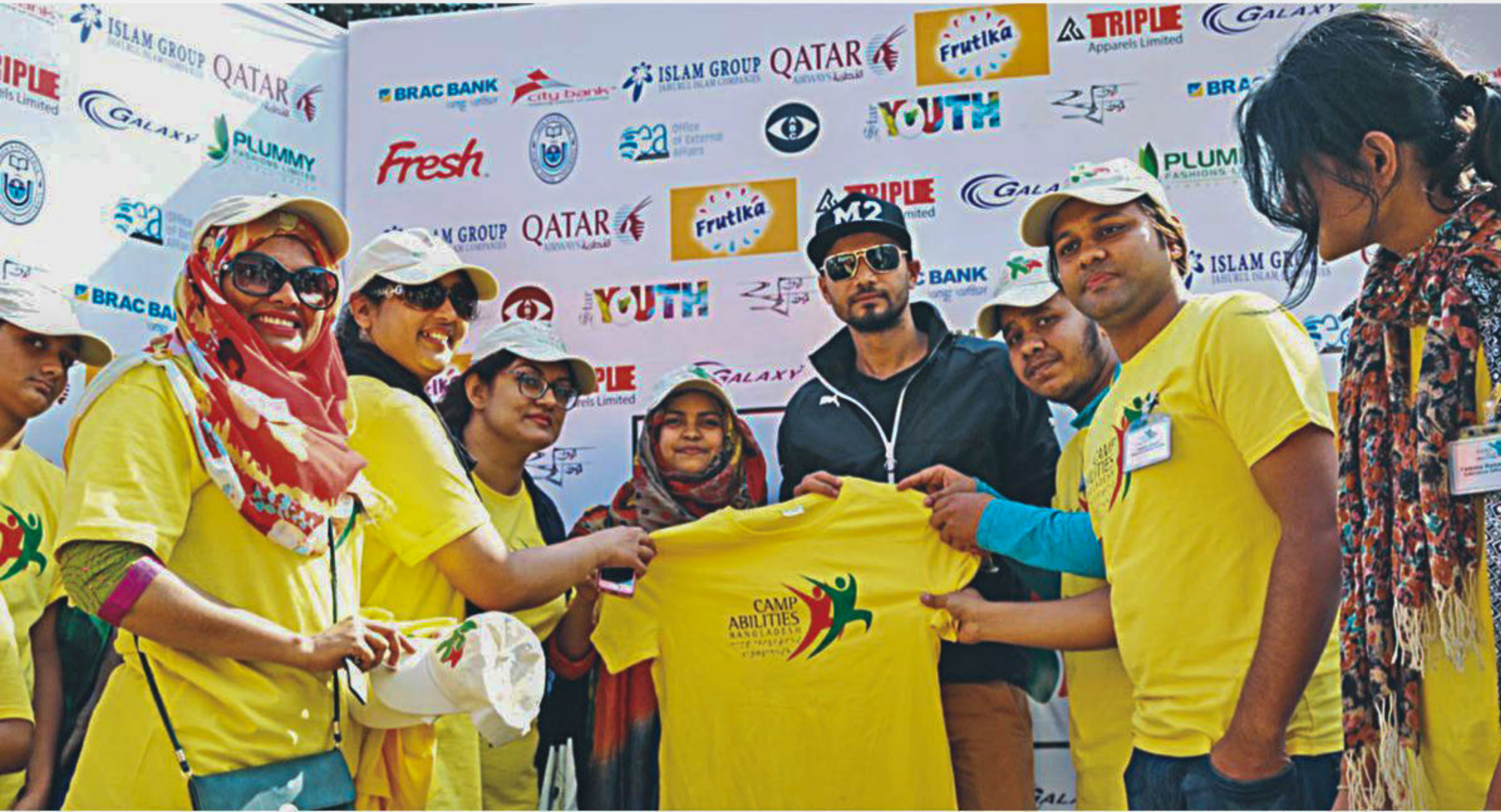
Bangladeshi cricketers Mashrafe Bin Mortaza and Mohammad Mushfiqur Rahim visit the camp.

An event with heroes who became each other's visions!