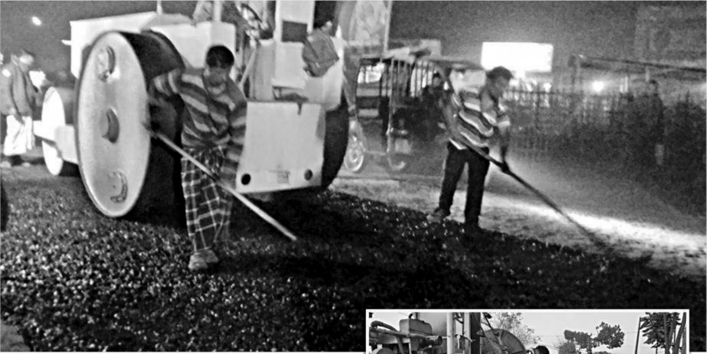
Workers of the construction firm in collusion with Roads and Highways Department officials do maintenance work of Lalmonirhat-Fulbari road in BDR Gate area of Lalmonirhat town on January 20 night, apparently to evade people’s notice of the alleged low quality work. Inset, dust is mixed with construction materials for carpeting work of Lalmonirhat-Mogholhat road at Banbhasa in Lalmonirhat Sadar upazila on January 21.