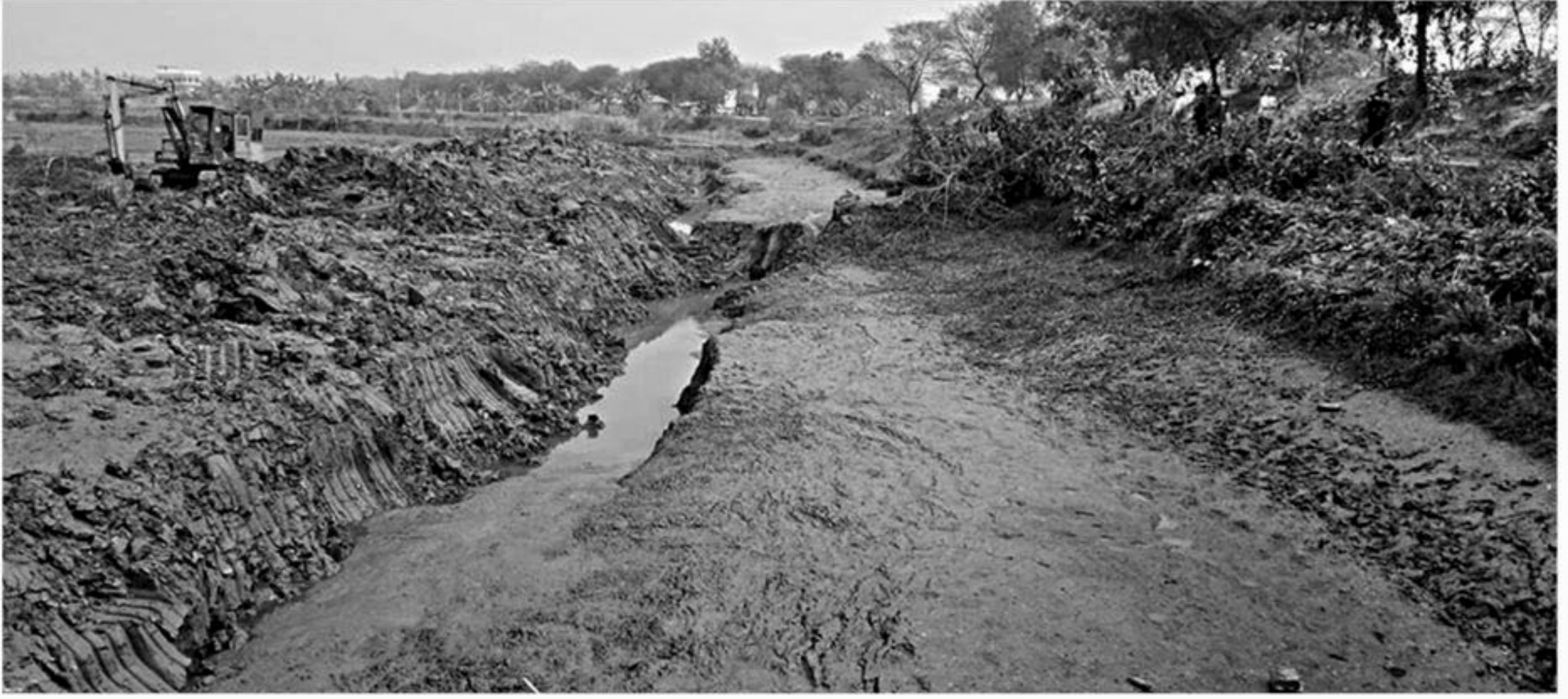
The Roads and Highways Department filed a case against a local brick kiln owner on Saturday night as mindless earth extraction from beside Muniganj Bridge on Bagerhat-Chitalmari road in Bagerhat posed an eventual risk for the bridge. The photo was taken earlier on the day.