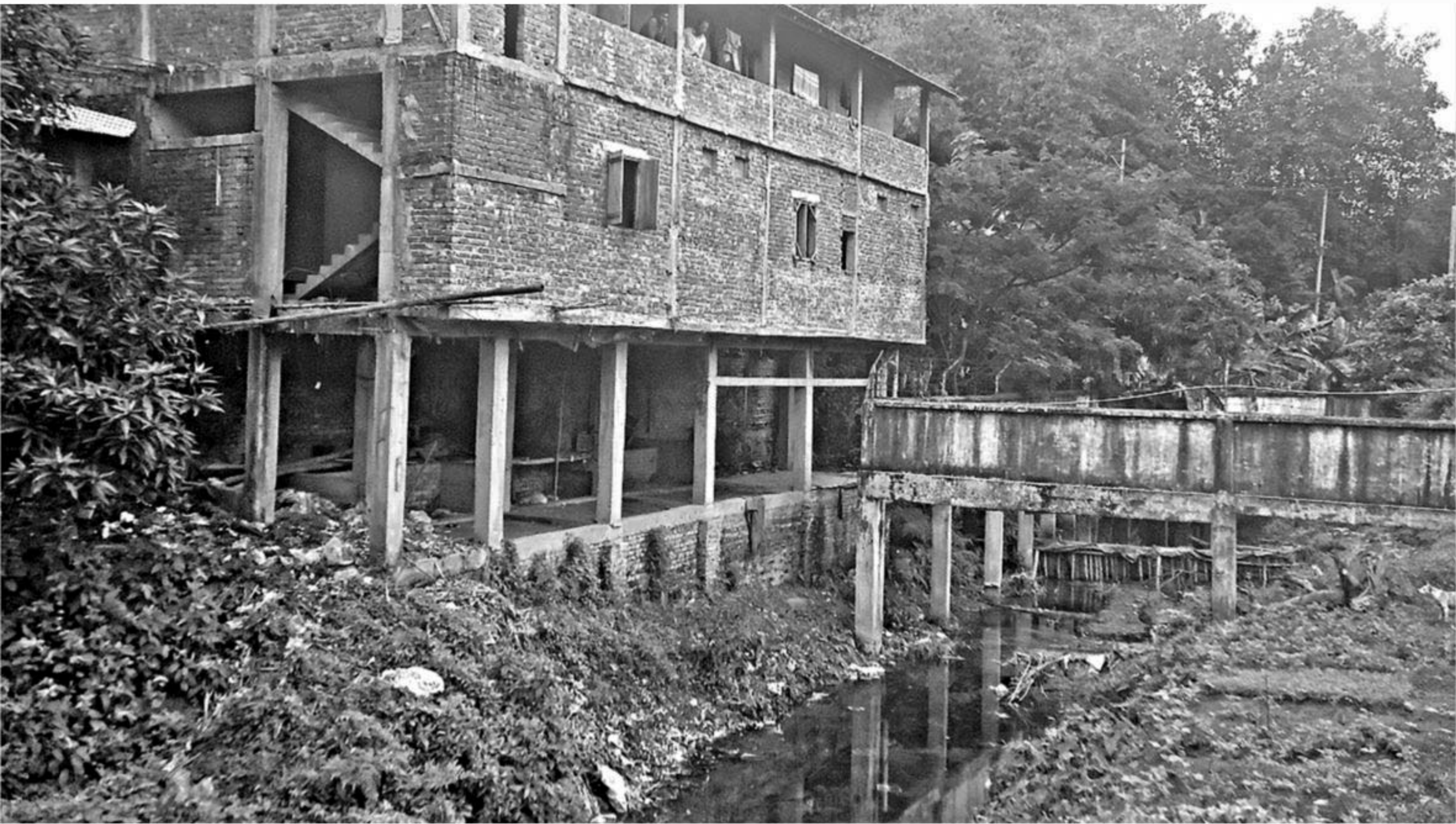
This recent photo shows illegal structures, including the demarcation wall erected by the authorities of Bangladesh Tea Board, occupying Unachhara at Sualok Bazar in Bandarban Sadar upazila.