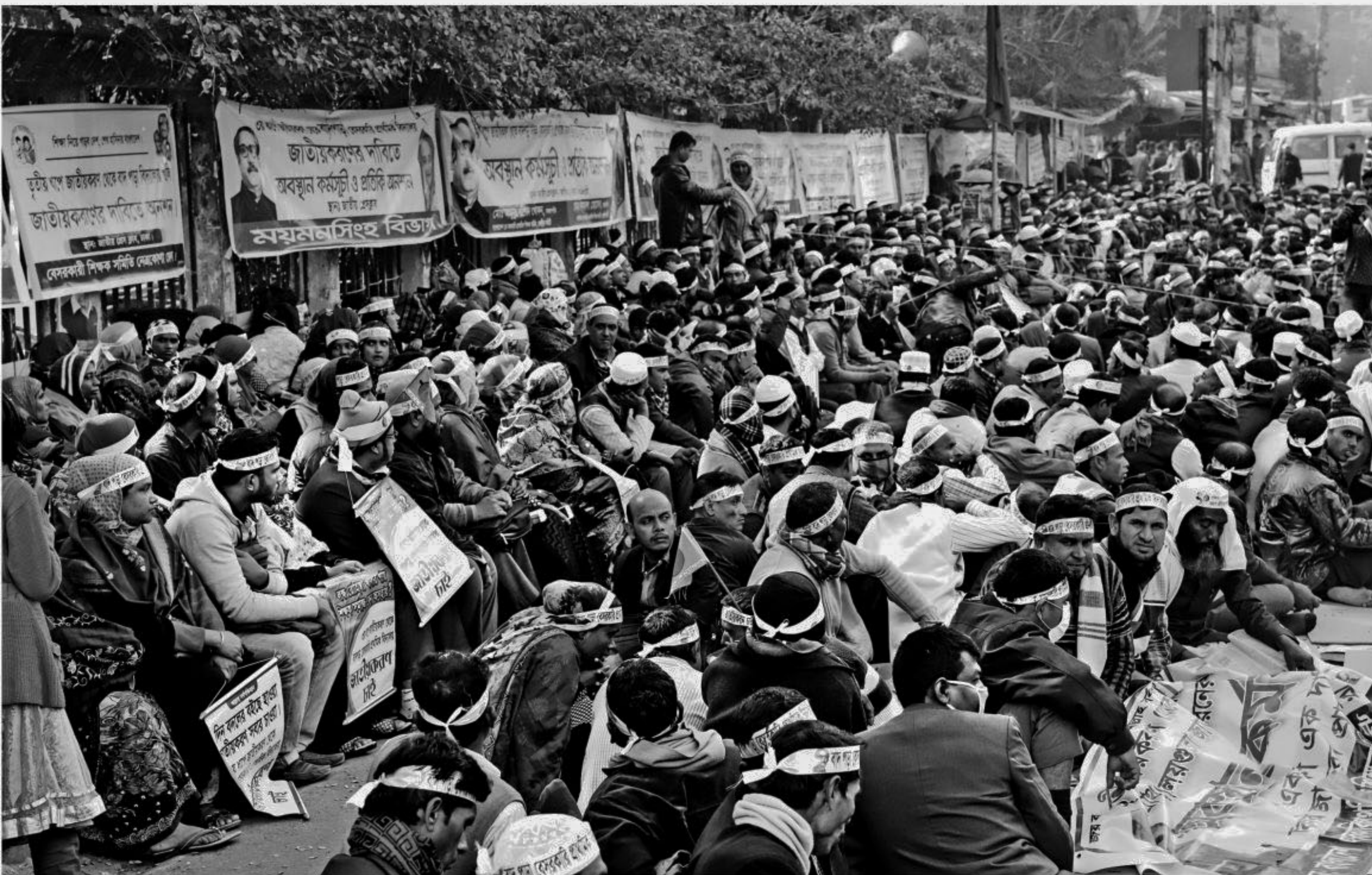
Several hundred teachers of non-government primary schools continue their "symbolic hunger strike" for the second day in front of Jatiya Press Club yesterday in the capital demanding nationalisation of their institutions.