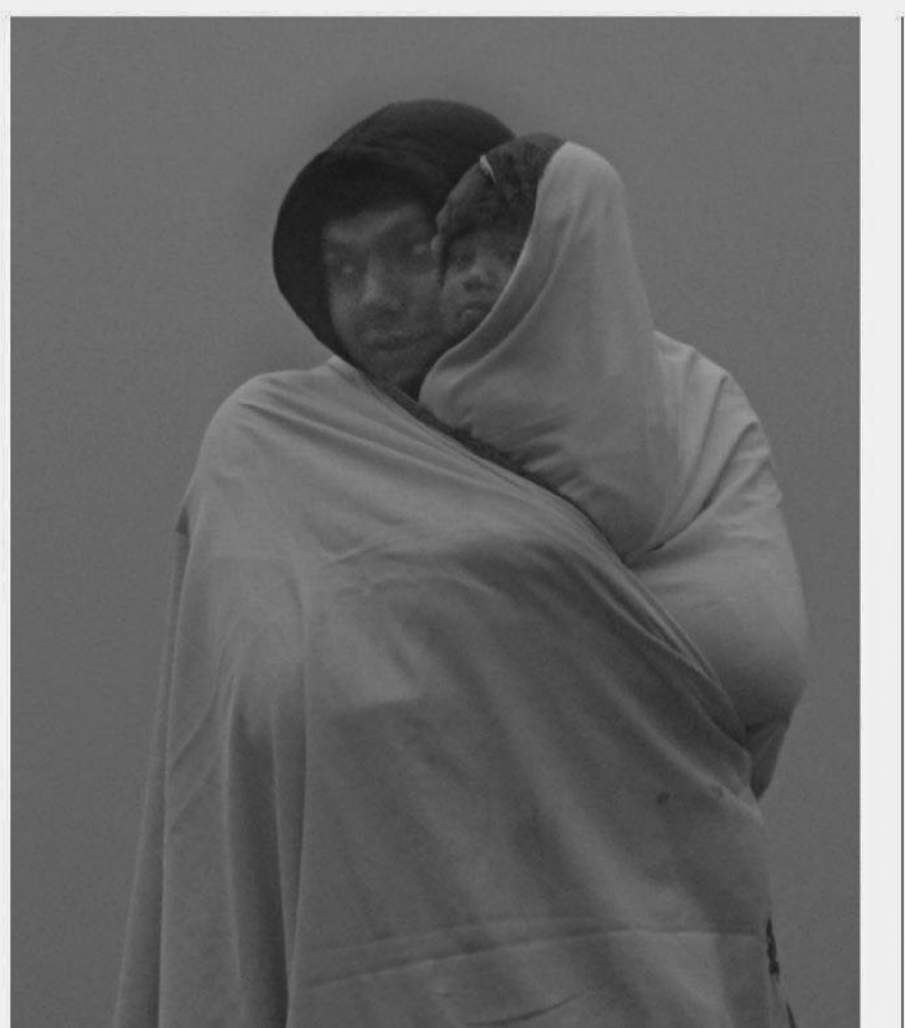
For much needed protection from the ongoing cold spell, a man wraps himself and his minor kid with a shawl at Uttar Saptana village in Lalmonirhat Sadar upazila yesterday.