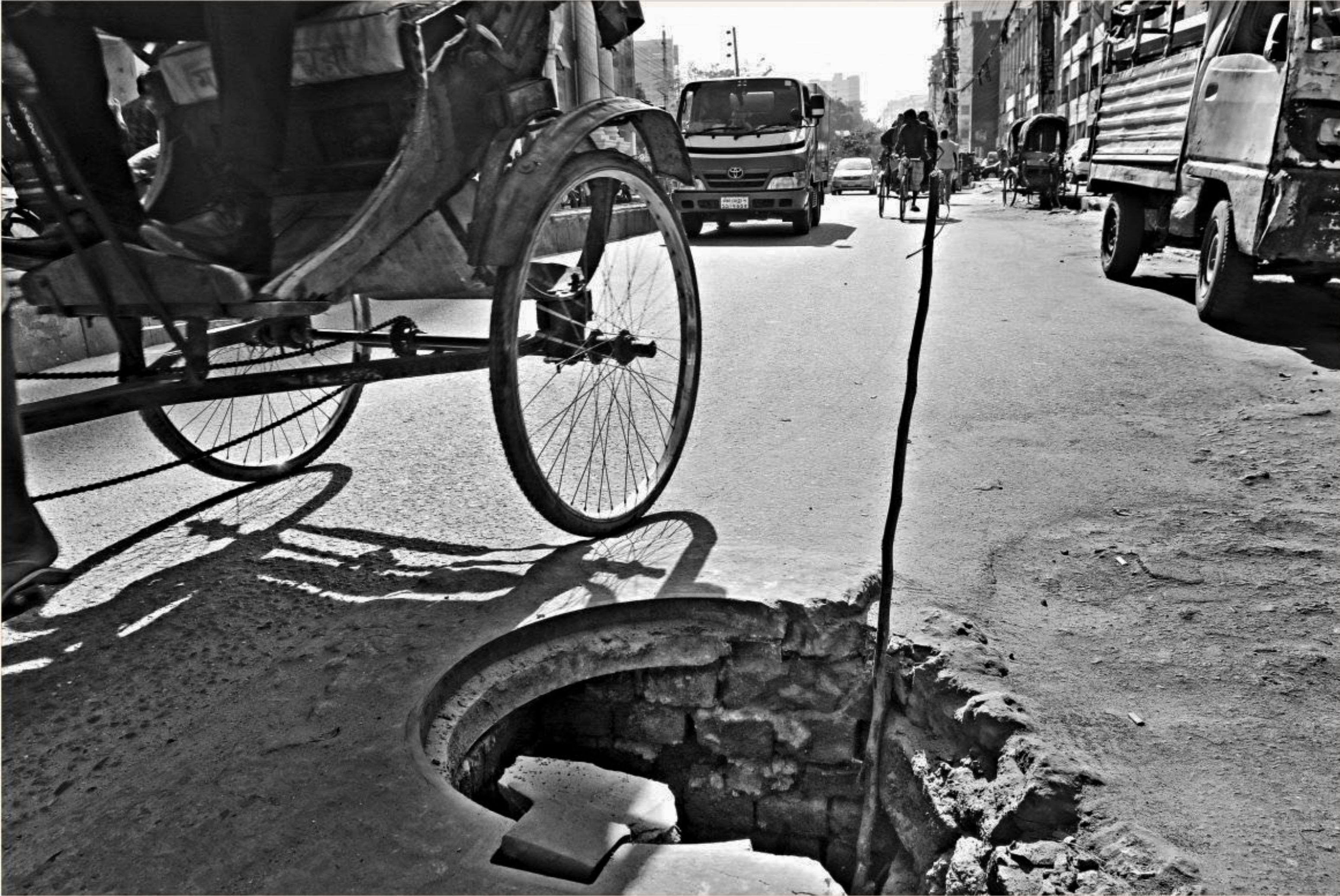
A rickshaw passes by a gaping manhole in the capital's Green Road. Apparently, someone has put a stick in it as a warning for oncoming vehicles but it does little to make the hole visible, especially at night. Lidless manholes have become a regular phenomenon in the capital and can cause a mishap at any moment. The photo was taken on Saturday.