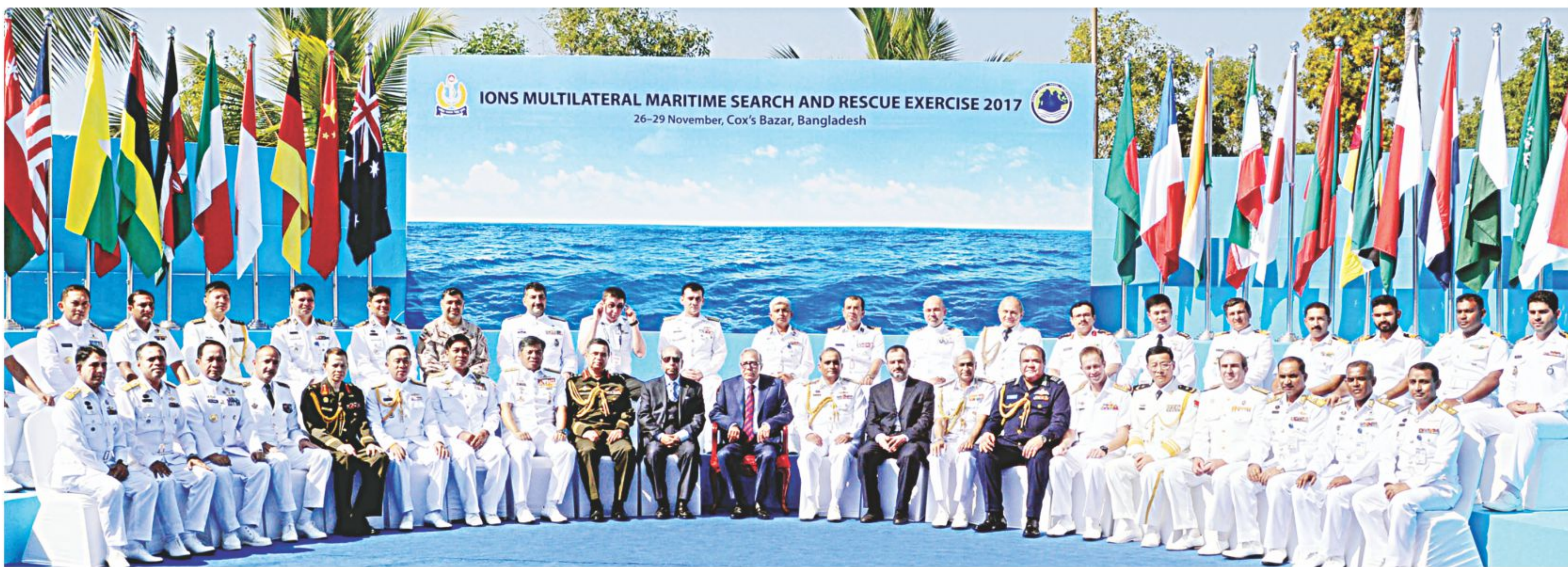
President Abdul Hamid among the participants of IONS Multilateral Maritime Search and Rescue Exercise 2017 in Cox's Bazar yesterday. The exercise concludes tomorrow.

Prof Yunus also discussed collaboration with Business University of Japan and Telecom Foundation.