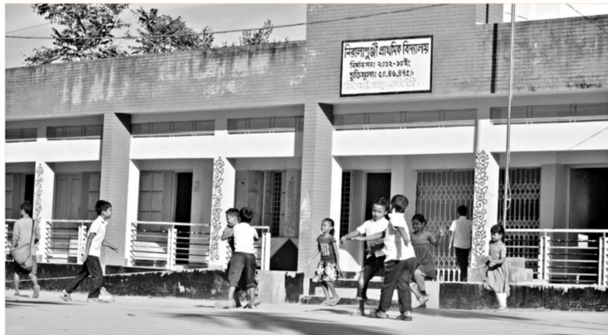
Niralapunjee Government Primary School in Sreemangal upazila under Moulvibazar. Academic activities of the school are being hampered due to absence of government appointed teachers for long while two volunteers run it without any experience or training.