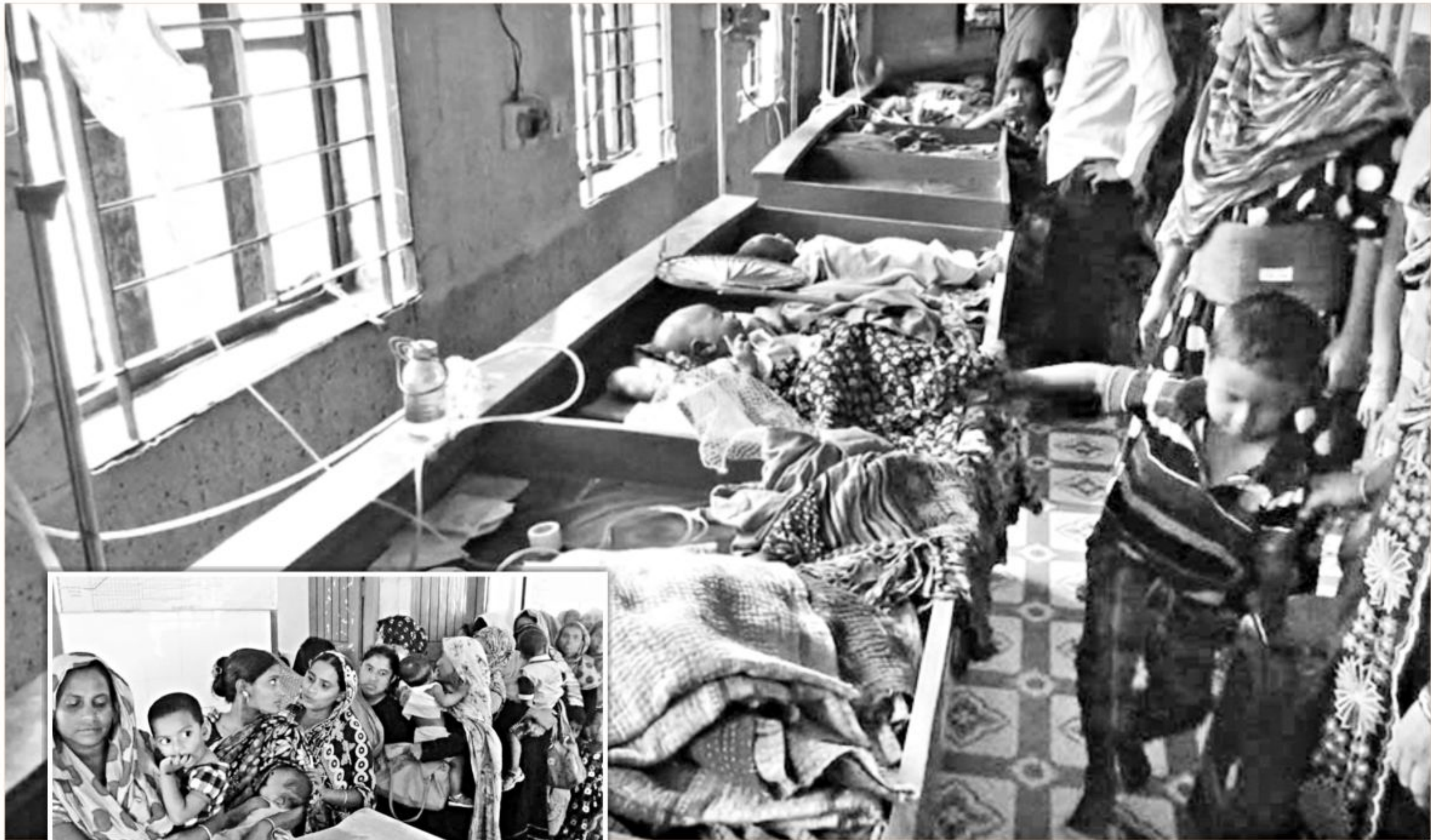
Kids, infected with pneumonia, receive treatment at the Children's Ward of Jhenidah Sadar Hospital. Inset, women, along with their children, standing in a queue as the number of beds is too inadequate to cope with the situation.