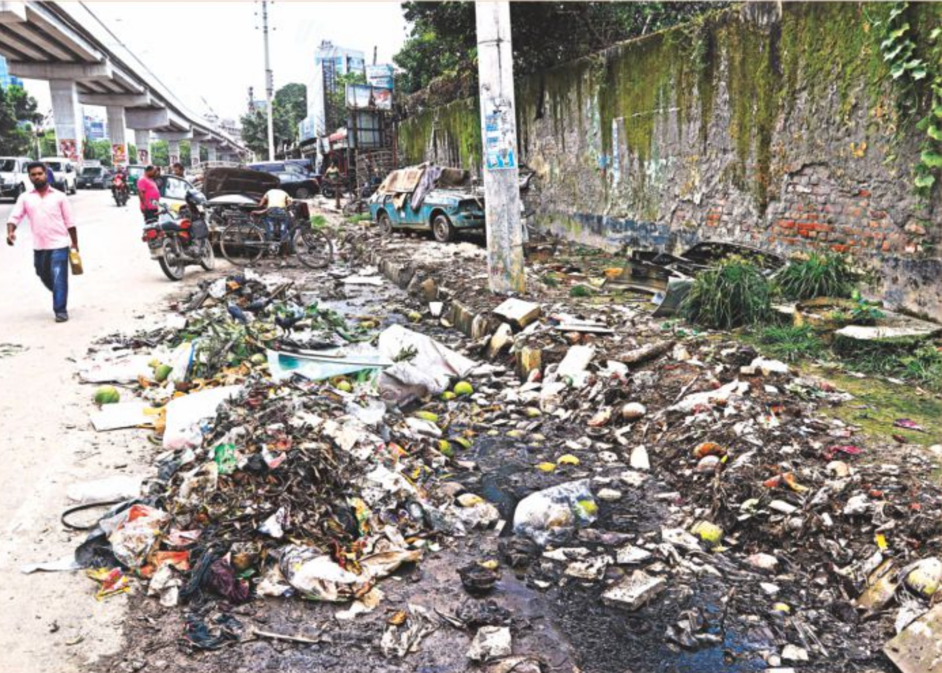
The footpath alongside the stretch of a road near Bangladesh Film Development Corporation (BFDC) in the capital is littered with garbage, forcing pedestrians onto the traffic lanes. The photo was taken yesterday.

FROM PAGE 3 Aminul Islam, 37, and Moksedur Rahman Akan, 38. PBI officials said they received complaints from at least 12 victims who lost around Tk 3 crore. They said the gang used to rent well-decorated commercial spaces or flats at different places and publish lucrative ads. Sometimes, their field operatives would communicate with such retired officials, they added. The PBI officials said if the potential victims were convinced, the gang members used to take them to their offices for meetings with their so-called managing director. Of the gang members, Harun, who knows Hindi well, used to introduce himself as an Indian businessman. After taking money, the gang would stop communicating and pack up their offices, said the PBI officials.