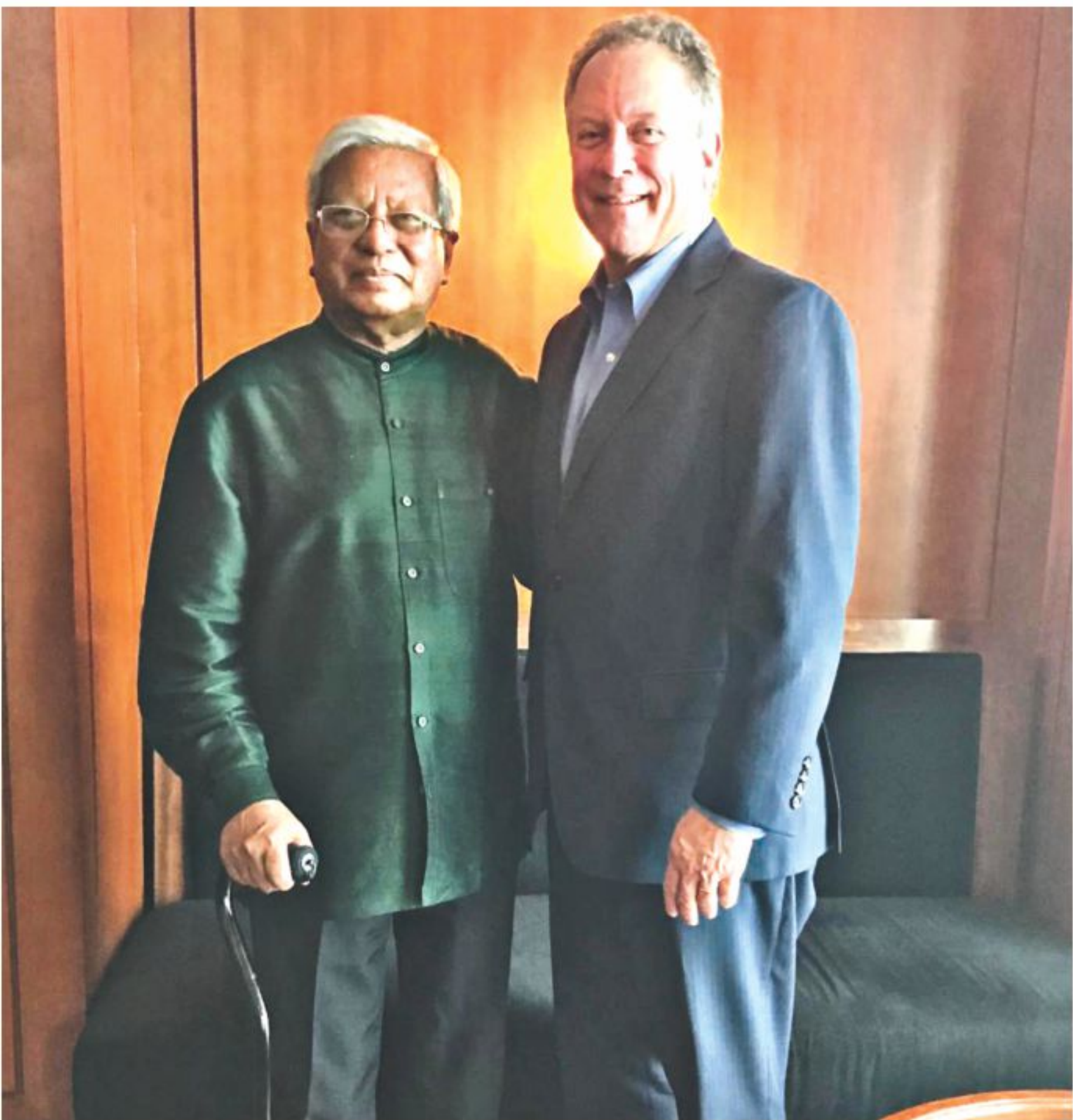
World Food Programme (WFP) Executive Director David Beasley and Brac Chairperson and Founder Sir Fazle Hasan Abed held a meeting in the capital yesterday. They shared insights about the ongoing humanitarian crisis in Cox's Bazar. Acknowledging WFP and Brac's longstanding relationship and mutual interest in holistic human development, both the organisations agreed to work together to address this crisis.