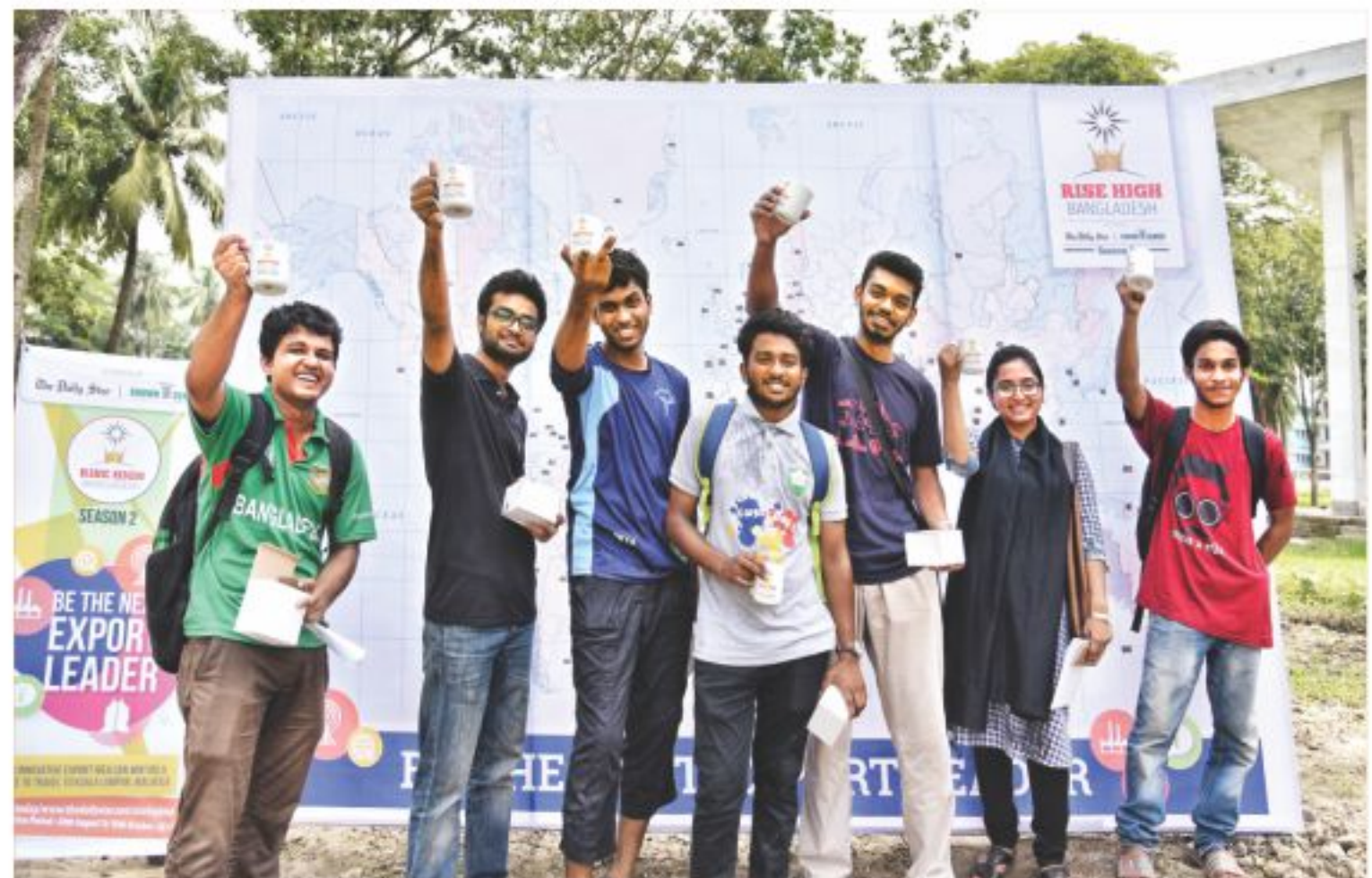
As part of the campus activation programme, the export idea contest “Rise High Bangladesh” covered two universities yesterday -- Independent University, Bangladesh (IUB), top , and the Khulna University of Engineering and Technology (Kuet), below right . Puzzle winners pose at the Bangladesh University of Engineering and Technology (Buet), below left , which the programme volunteers visited the day before. During activation, the volunteers explain to students the objectives, incentives, and rules of participation of the contest.