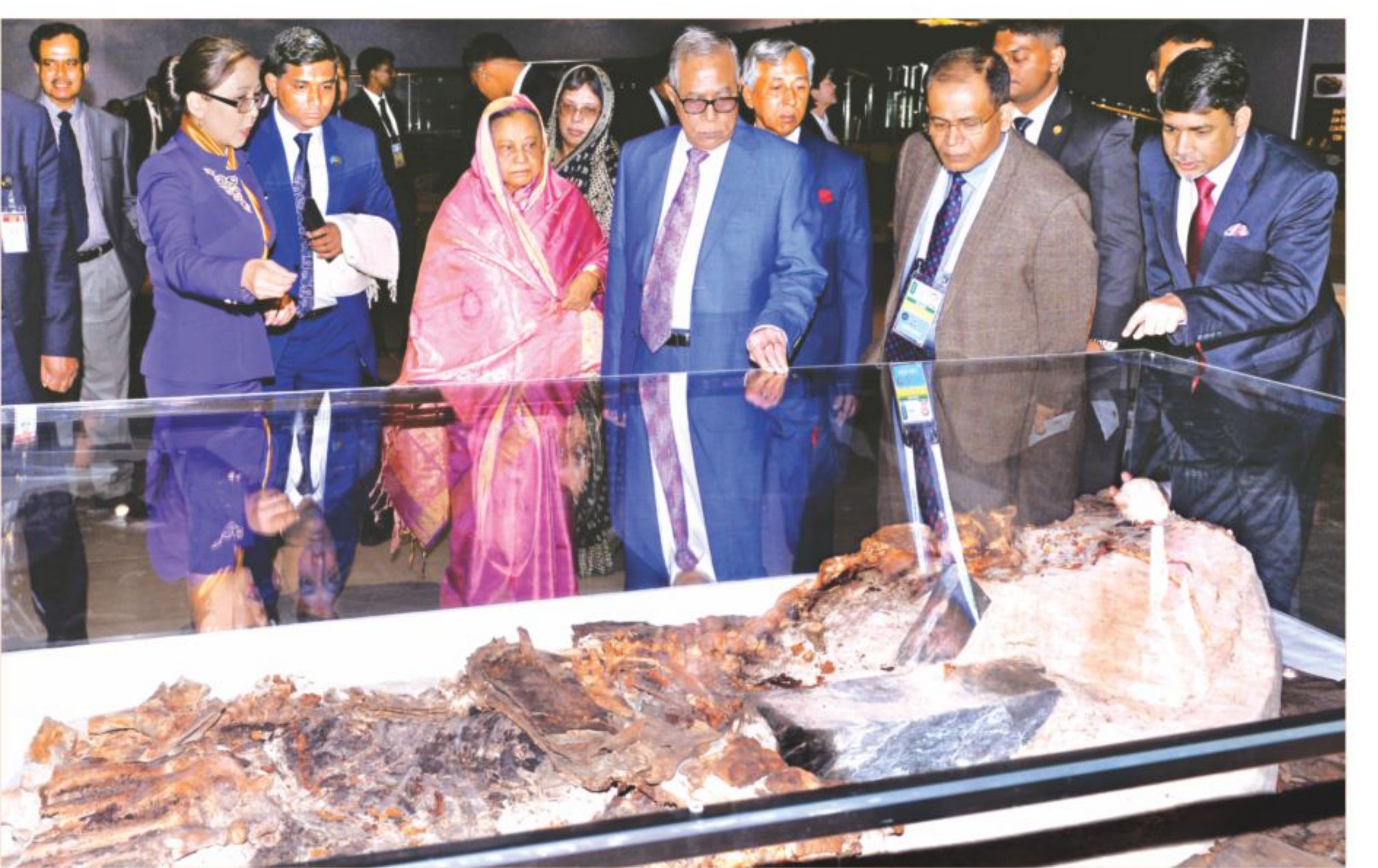
President Abdul Hamid visits National Museum of Kazakhstan yesterday. The day before, he attended the opening ceremony of the First Summit on Science and Technology of the Organisation of Islamic Cooperation (OIC) in Astana.