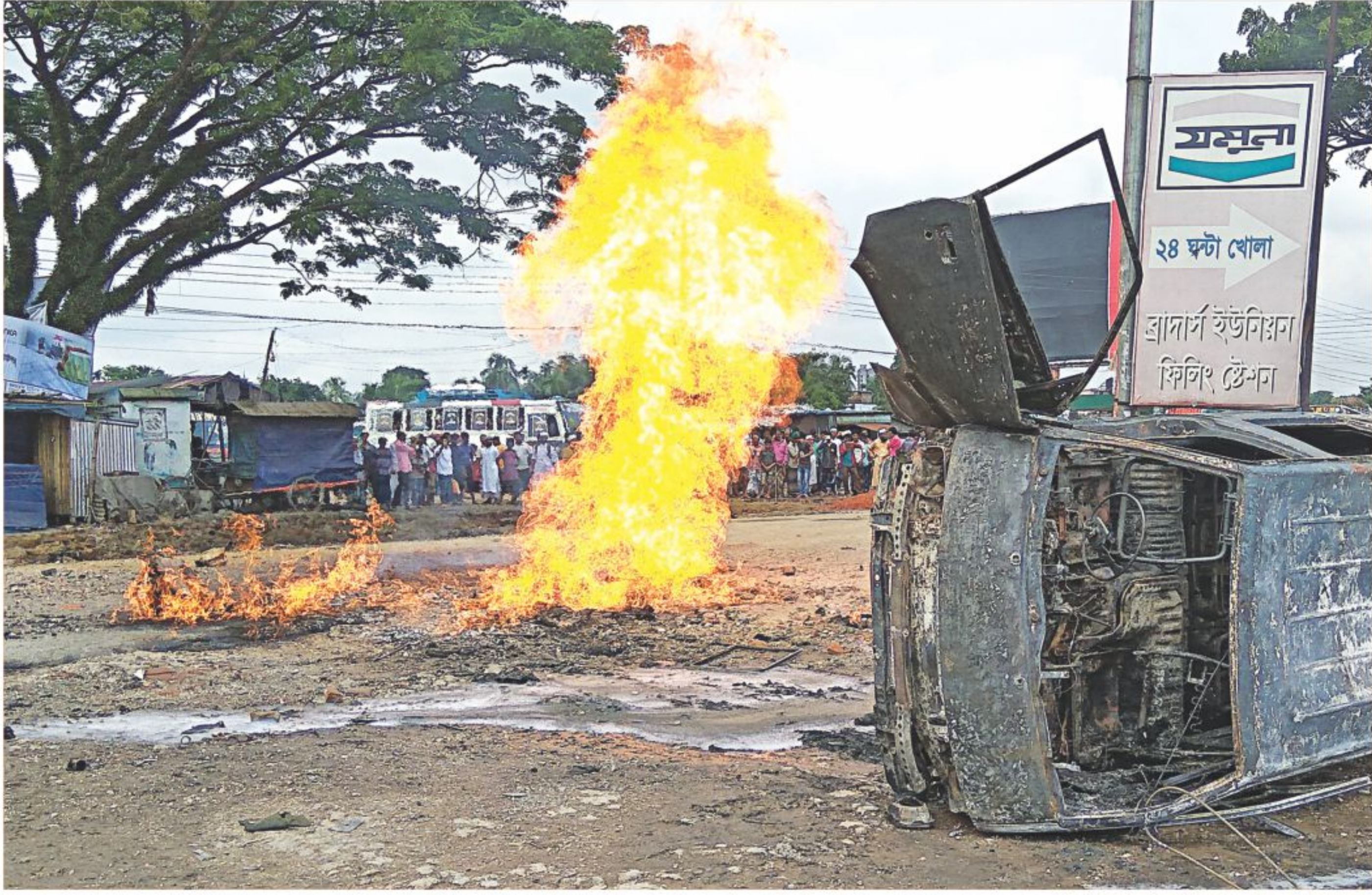
The charred wreckage of a microbus lies on its side with fire burning close by following an explosion from a gas leak in Sylhet's Jalalabad Central Bus Terminal area yesterday. Six people were injured and three vehicles, including a private car and a motorbike, caught fire in the explosion.

OUR CORRESPONDENT, Gazipur A National University examination centre has been shifted for a day from Gazipur's Bhawal Badre Alam Government College without any prior notice, as local Awami League is going to hold a public meeting on the campus today. The authorities of the university would hold today's exams in nearby schools and collages following requests from the college principal. The new committee of Gazipur Awami League would hold the meeting around 3:00pm. AL General Secretary Obaidul Quader is expected to attend it as the chief guest, sources said. According to the NU, around 1,600 students of Tongi Government College are about to sit for their master's exams, starting at 1:30pm, on different subjects at the Bhawal Badre Alam Government College exam centre. The students of Bhawal Badre Alam Government College will take part in their exams at the Tongi Government College exam centre. Examination controller of NU Mohammad Badruzzaman said though the NU did not issue any prior notice regarding shifting the centre, "they took initiatives so that students would get the message." A notice had already been put up on the college notice SEE PAGE 12 COL 5