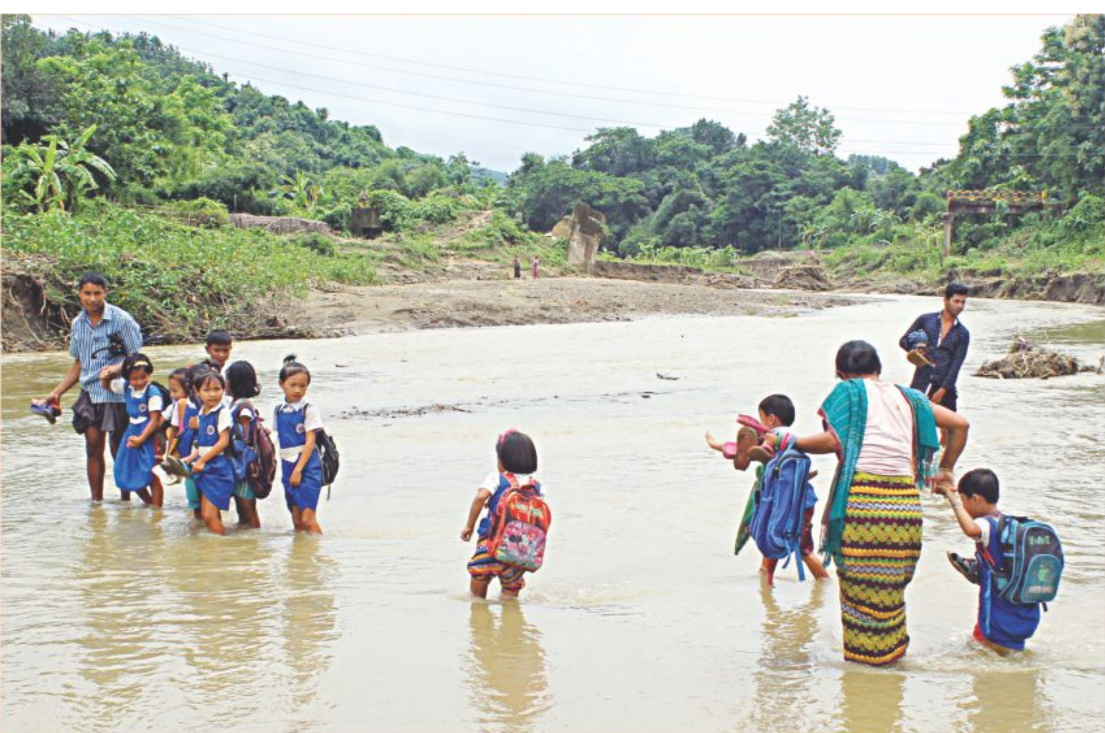
Children have to wade across a canal on way to school as a portion of the bridge was washed away by heavy rains and onrush of hilly water last month. The bridge used to connect Dulonnye village to the rest of Kaptai upazila at Rangamati. The photo was taken Thursday. Story on page 2