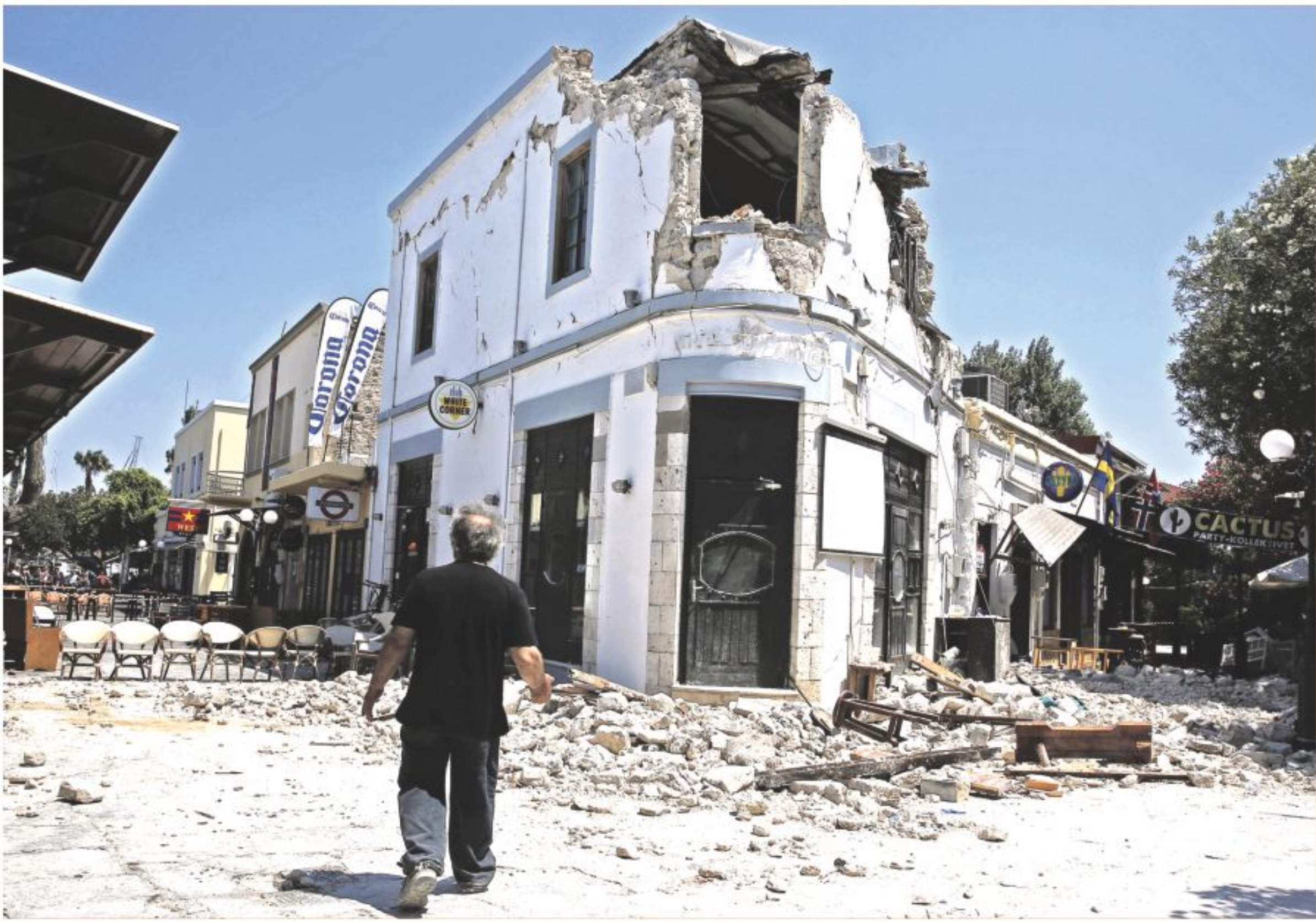
(From left, anti-clockwise) A man stands in front of a damaged building following an earthquake off the island of Kos, Greece; a car is seen under the debris of a collapsed building in the same tourist island; and damaged boats are seen after a tsunami in the resort town of Gumbet in Mugla province, Turkey. A 6.7-magnitude undersea quake hit the Greek holiday island of Kos and the Turkish resort of Bodrum yesterday, killing two people and injuring hundreds in areas abuzz with nightlife.

The dispute erupted when regional powerhouse Saudi Arabia, UAE, Bahrain, Egypt broke ties with Qatar on June 5, accusing it of backing extremism. Doha denies the claim. They have imposed sanctions on Doha, including closing its only land border, refusing Qatar access to their airspace and ordering their citizens back from Qatar.