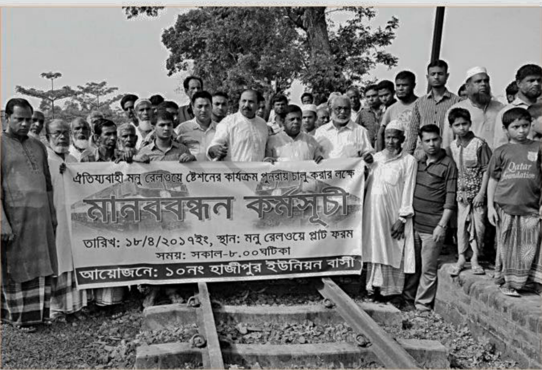
Local people form a human chain on the rail lines yesterday, demanding reopening of the closed Monu railway station in Kulaura upazila of Moulvibazar.