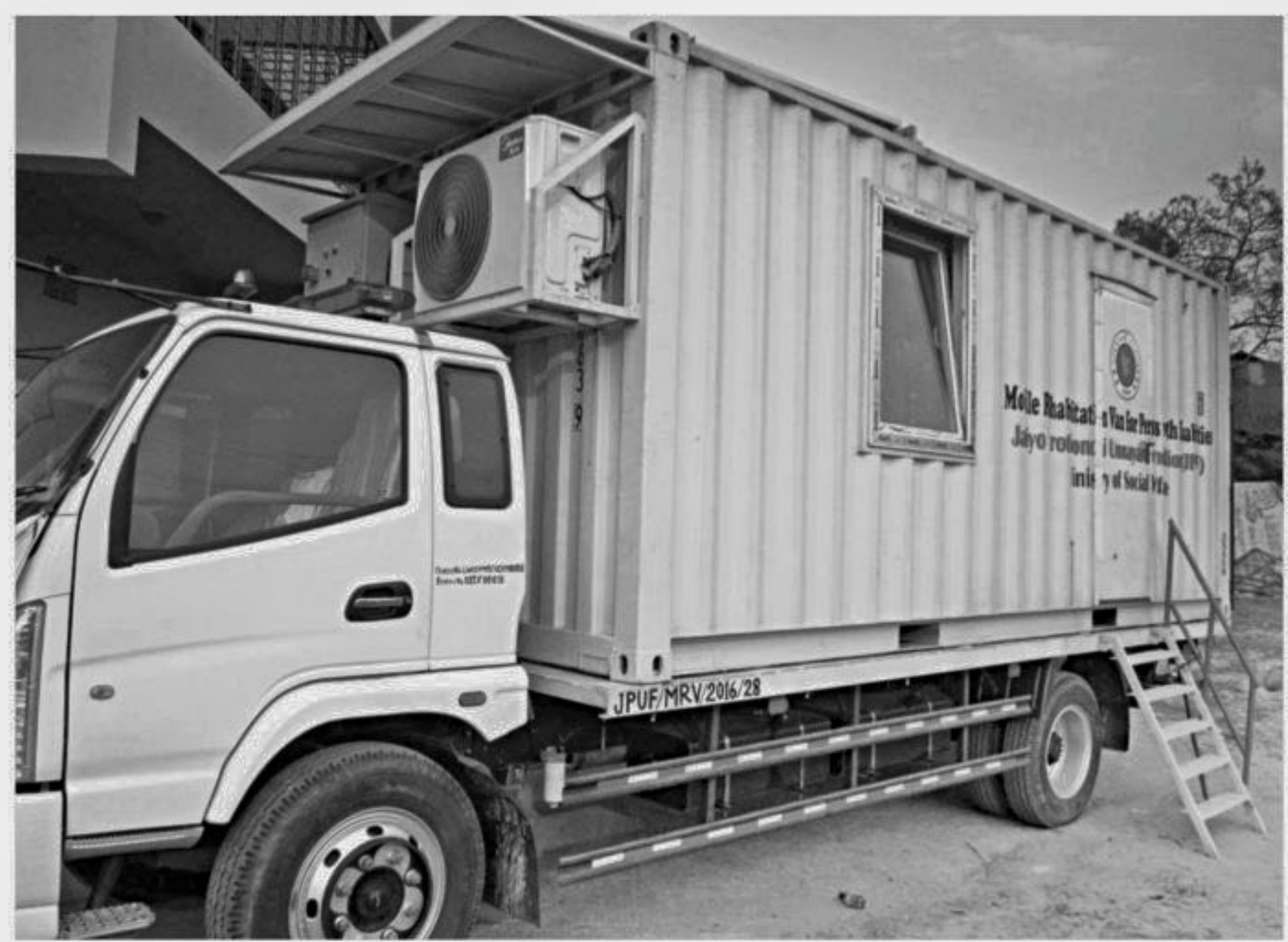
This van equipped with modern treatment facilities provides free services for poor physically challenged people in Patuakhali district as part of an initiative of Jatiya Protibondhi Unnayan Foundation. Right, a man receives treatment inside the mobile clinic at Kuakata on Monday.

Commuters on Kathalia-Rajapur-Jhalakathi road have been experiencing untold sufferings for long due to dilapidated condition of the road.