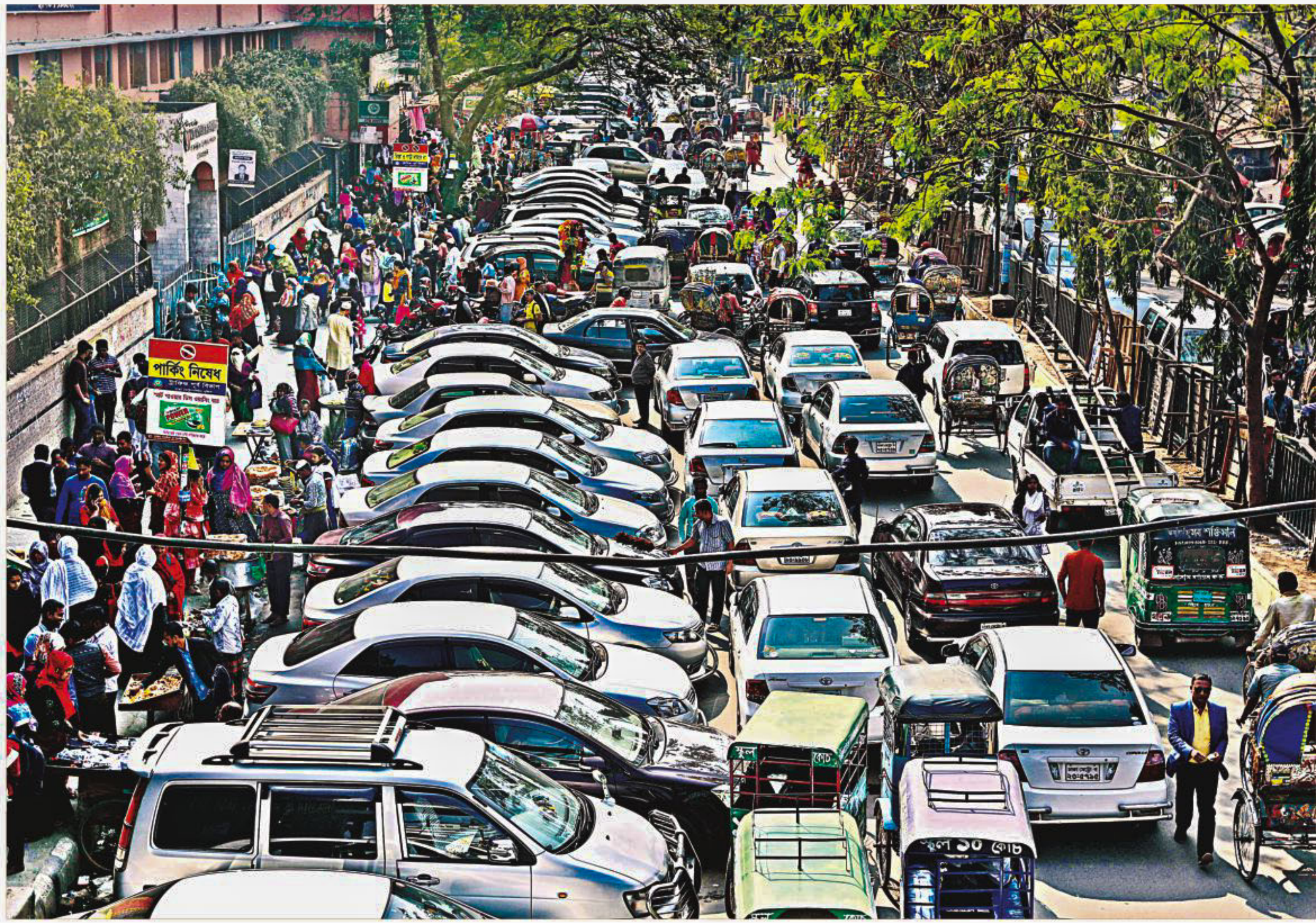
Ignoring a no-parking sign, cars parked on a street in front of Motijheel Ideal School in the capital around noon yesterday. Such illegal parking blocks almost half of the street, causing severe traffic jam in the area on weekdays.