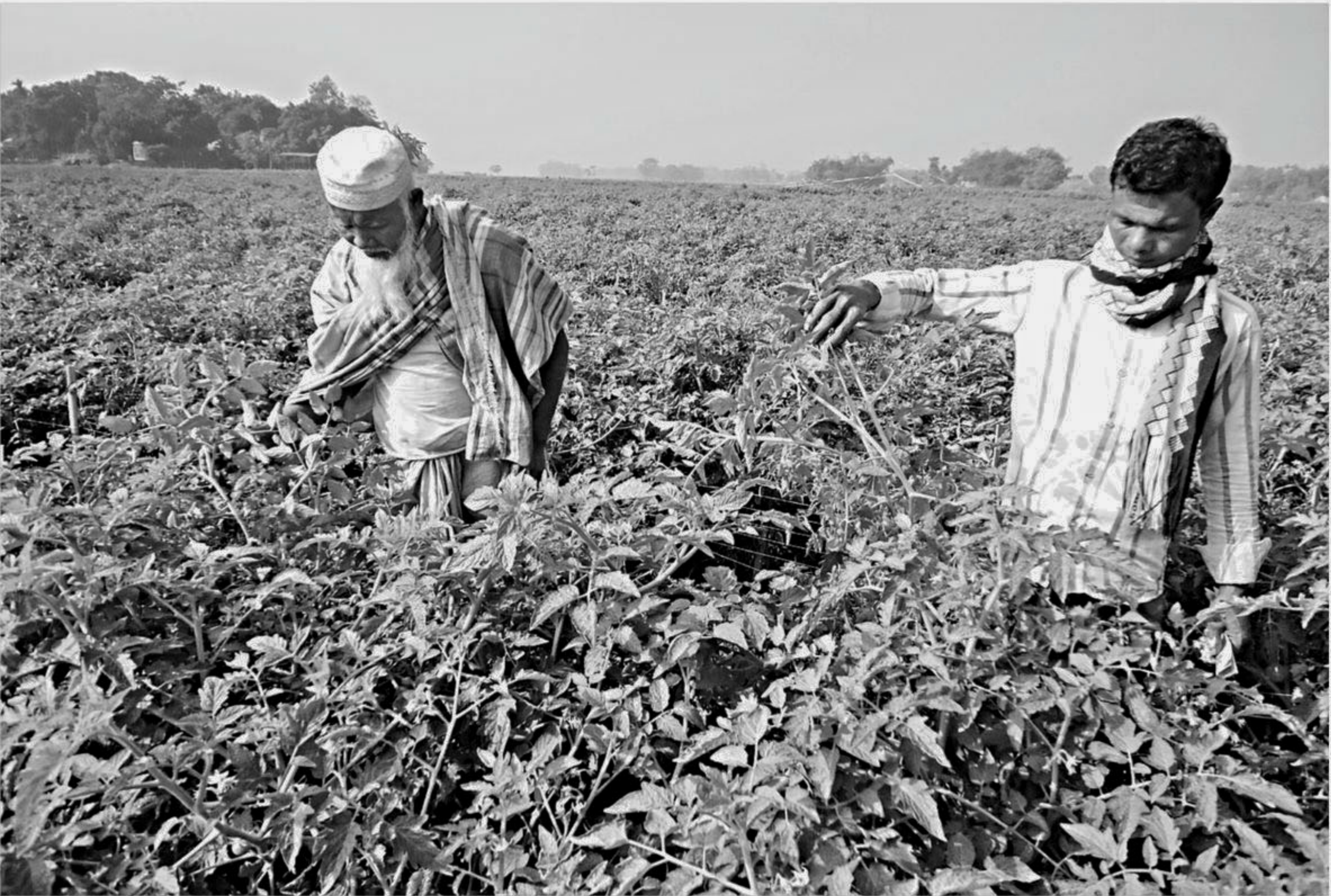
Visibly upset farmers see sterile tomato plants at a field of Bagherkanda village in Bororchar union under Mymensingh Sadar upazila during the ongoing peak harvesting season.